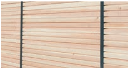
▲ Holzbelattung Douglasie, waagrecht