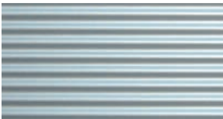
▲ Aluminiumwellblech, waagrecht