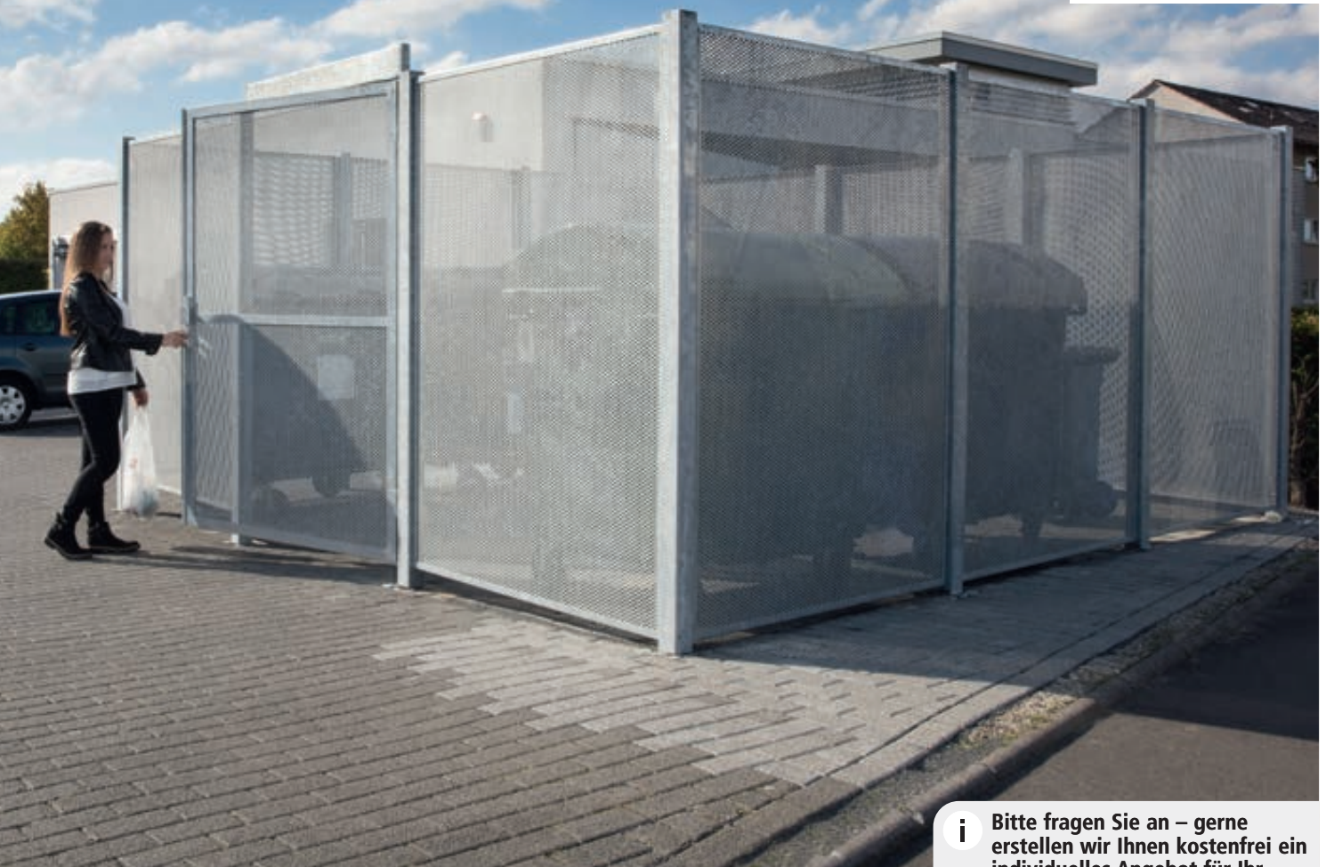
Sichtschutzwand MURO als Wertstoffumhausung, Breite x Tiefe 4580 mm x 4580 mm, Wandelemente und Flügeltüre aus Lochblech, Stahlkonstruktion feuerverzinkt

HOLZLEISTEN IN TOP QUALITÄT ★★★★★ Allseits gehobelt, geschliffen und hochwertig lasiert