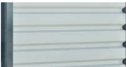
▲ Trapezblech, waagrecht