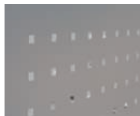
▲ Blech gelasert, mit Quadratlochmuster