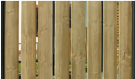
▲ Holzbelattung Fichte, senkrecht