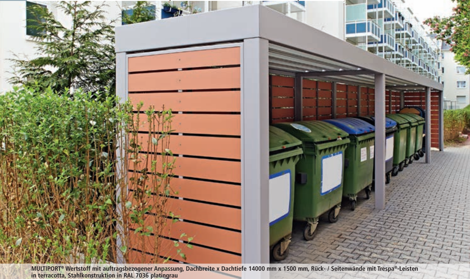
MULTIPOINT® Wertstoff mit auftragsbezogener Anpassung, Dachbreite x Dachtiefe 14000 mm x 1500 mm, Rück- / Seitenwände mit Trespa®-Leisten in terracotta, Stahlkonstruktion in RAL 7036 platingrau