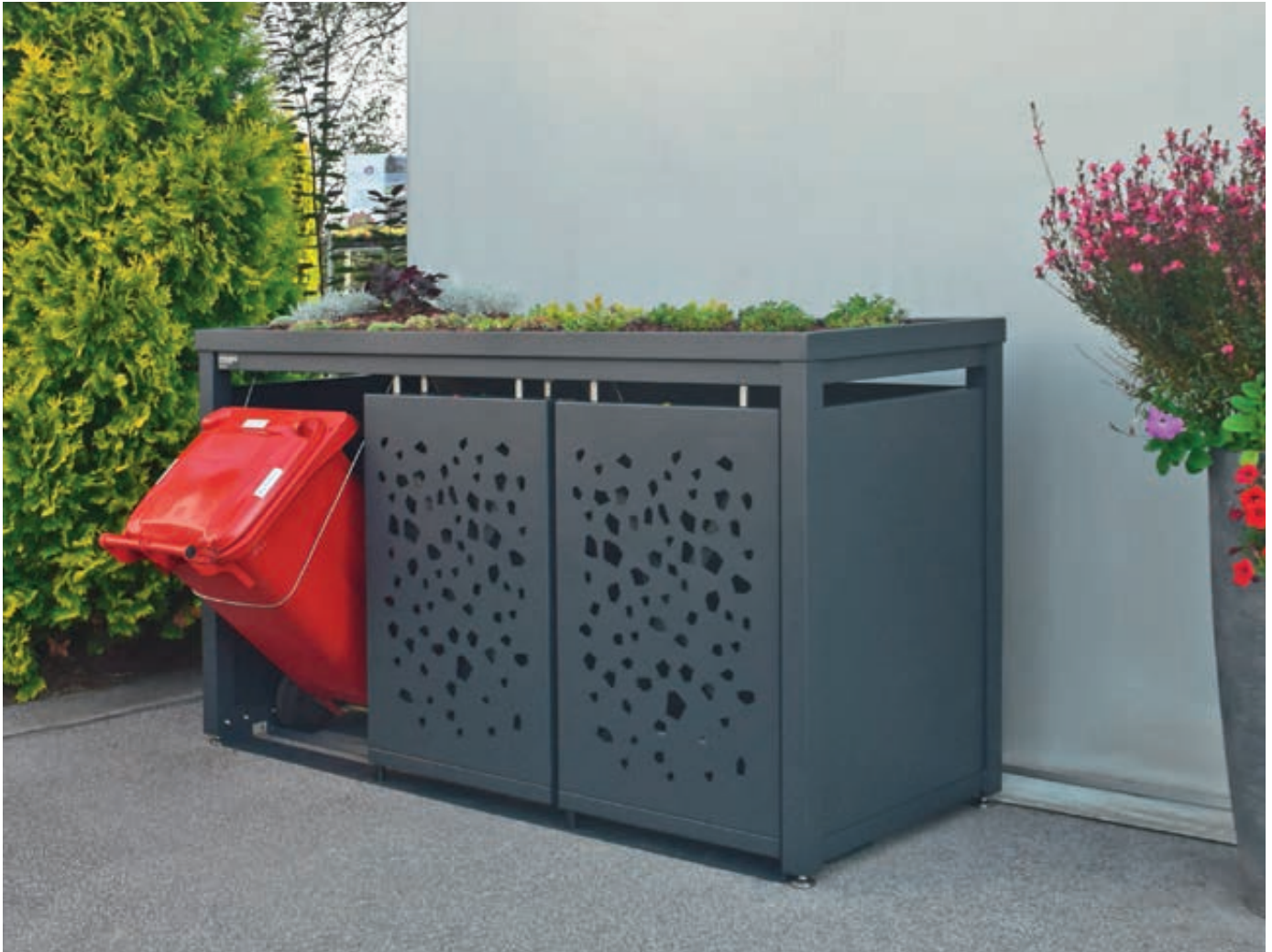
Müllbehälter-Dreifachschrank STYLEOUT® TOMO mit Pflanzdach, Dachbegrünung (bauseits), Aluminiumkonstruktion in RAL 7016 anthrazitgrau