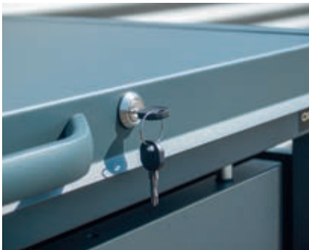
▲ Detail: Schlüssel