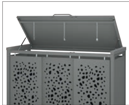
▲ Detail Klappdach