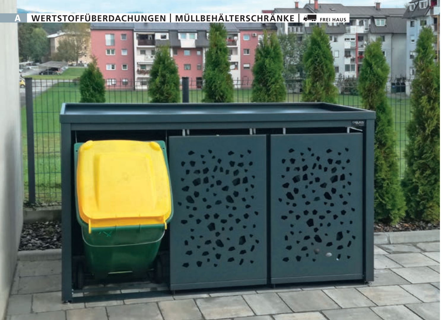
Müllbehälter-Dreifachschrank STYLEOUT® TOMO mit Pflanzdach, Aluminiumkonstruktion in RAL 7016 anthrazitgrau