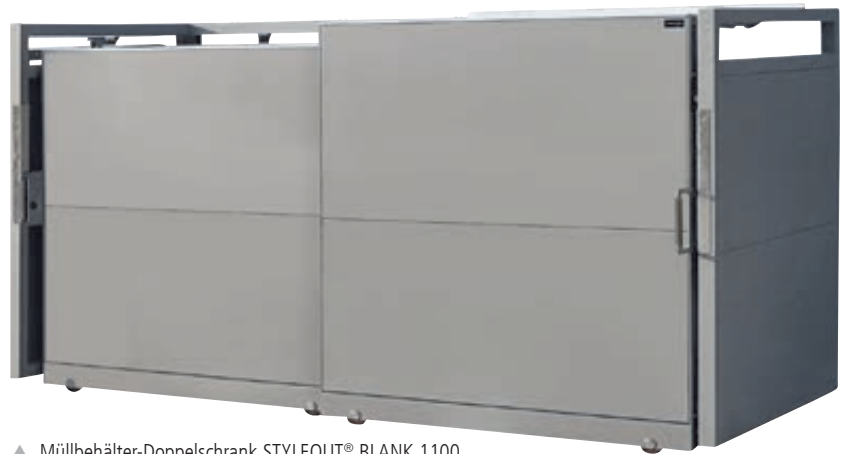
▲ Müllbehälter-Doppelschrank STYLEOUT® BLANK 1100, Aluminiumkonstruktion in RAL 9007 grau-aluminium

Weitere Bilder, Informationen und Ausschreibungstexte: www.ziegler-metall.de