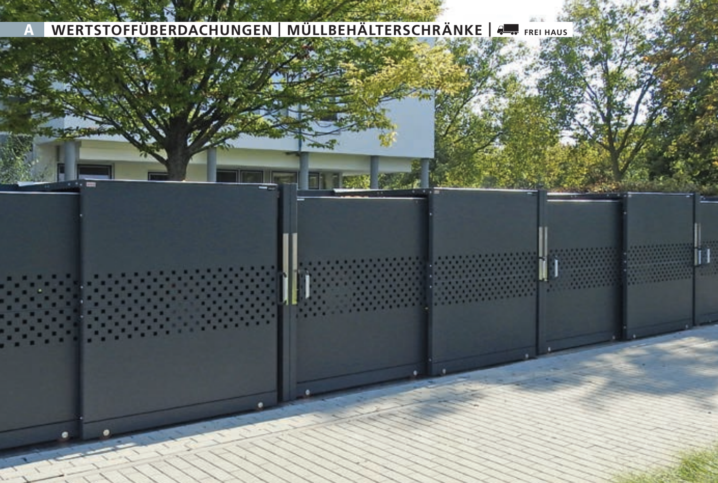
Müllbehälter-Doppelschrank STYLEOUT® QUBIS 1100 für 4-Rad-Abfallgroßbehälter, Schiebetüren mit Quadratlochung, Aluminiumkonstruktion in RAL 7016 anthrazitgrau