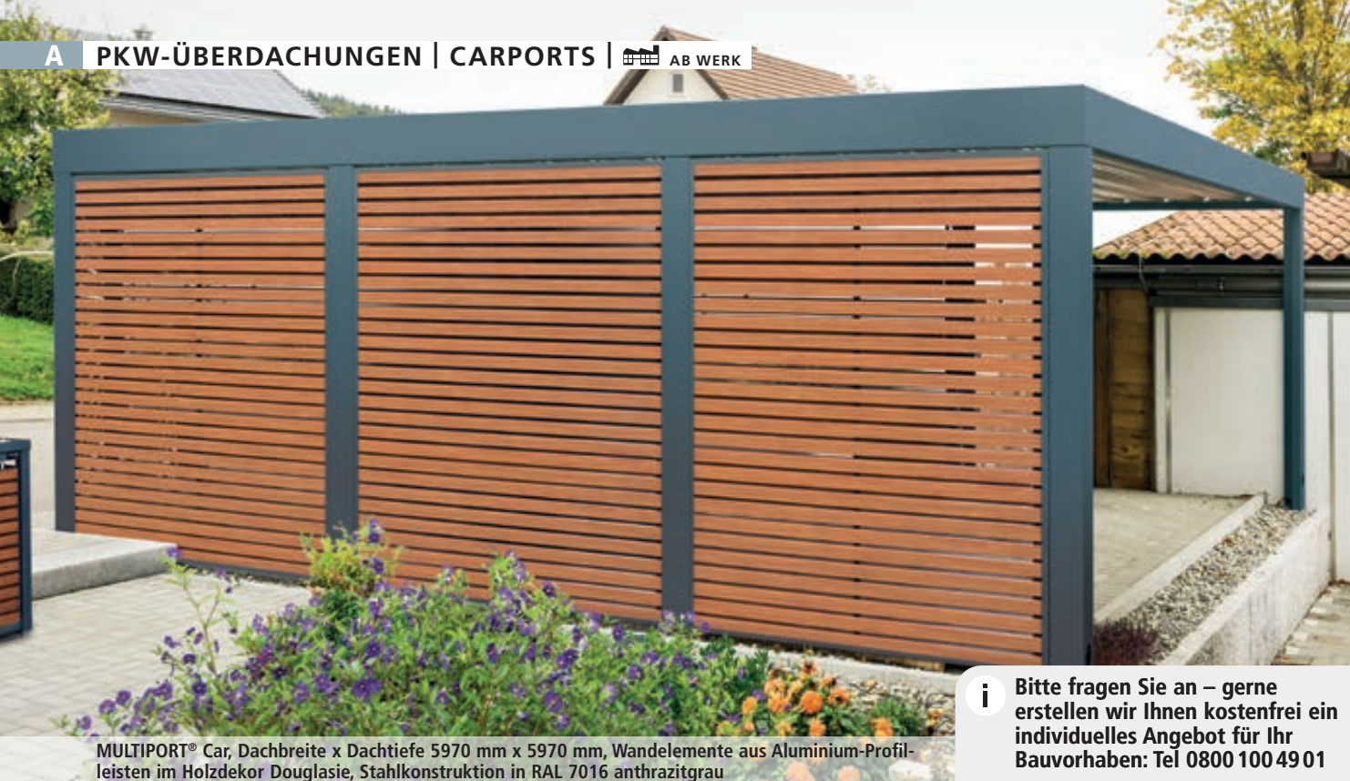
MULTIPOINT® Car, Dachbreite x Dachtiefe 5970 mm x 5970 mm, Wandelemente aus Aluminium-Profilen im Holzdekor Douglasie, Stahlkonstruktion in RAL 7016 anthrazitgrau

i Bitte fragen Sie an – gerne erstellen wir Ihnen kostenfrei ein individuelles Angebot für Ihr Bauvorhaben: Tel 0800 100 4901