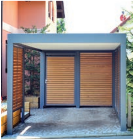
▲ MULTIPOINT® Car, Dachbreite x Dachtiefe 9030 mm x 9030 mm, lichte Höhe 3000 mm (auftragsbezogene Anpassung), Mitteltrennwand aus WPC-Rhombus-Profil, Terra dunkelbraun, Stahlkonstruktion in RAL 7016 anthrazitgrau