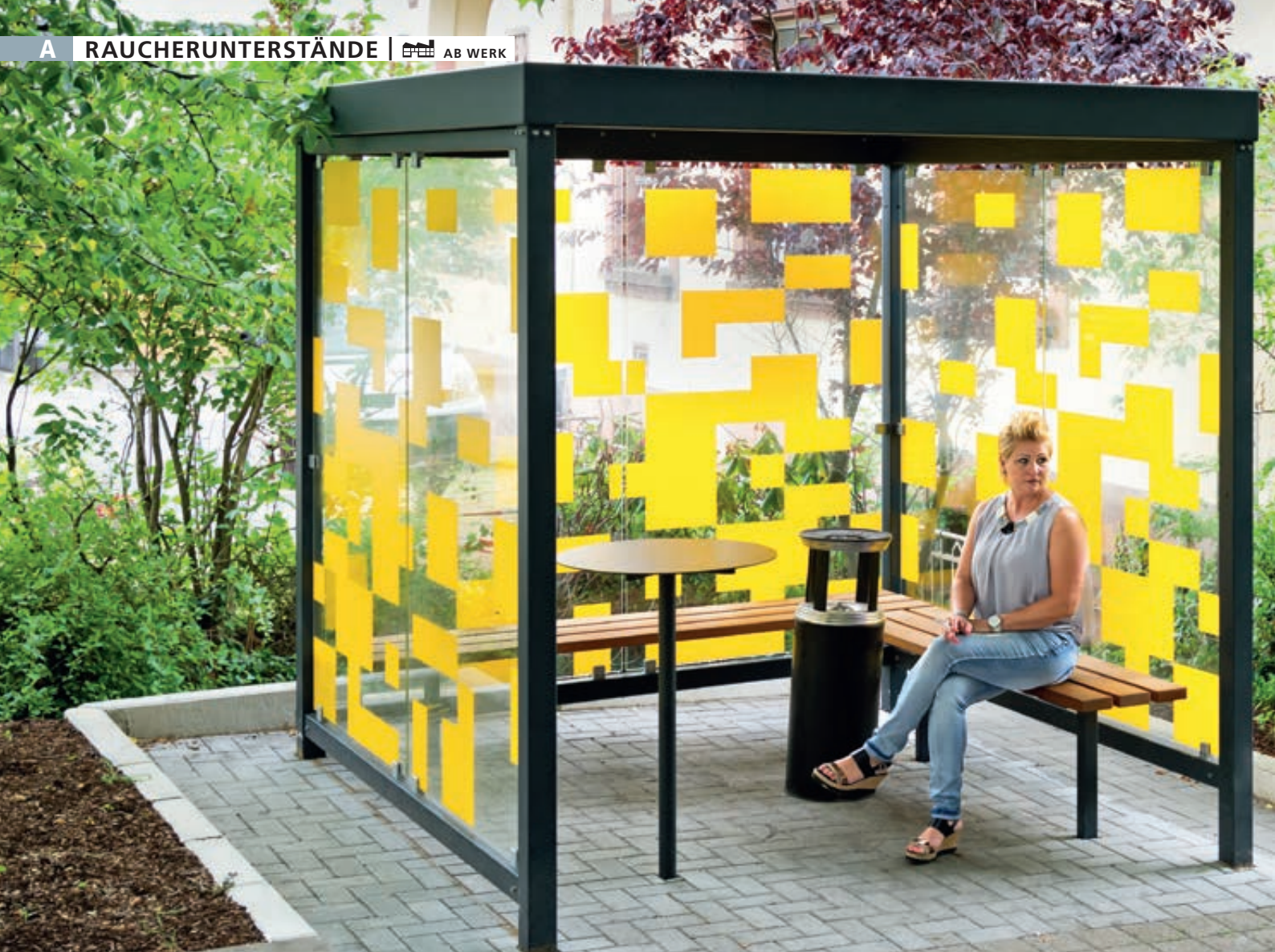
Raucherunterstand TOBACCO, Dachbreite x Dachtiefe 2400 mm x 2400 mm, mit Rück- / Seitenwänden, zweiseitige Sitzbank TOBACCO, Abfallbehälter / Ascher CALGARY sowie Stehtisch BISTROT, Stahlkonstruktion in RAL 7016 anthrazitgrau, Scheibendekorbeklebung bauseits