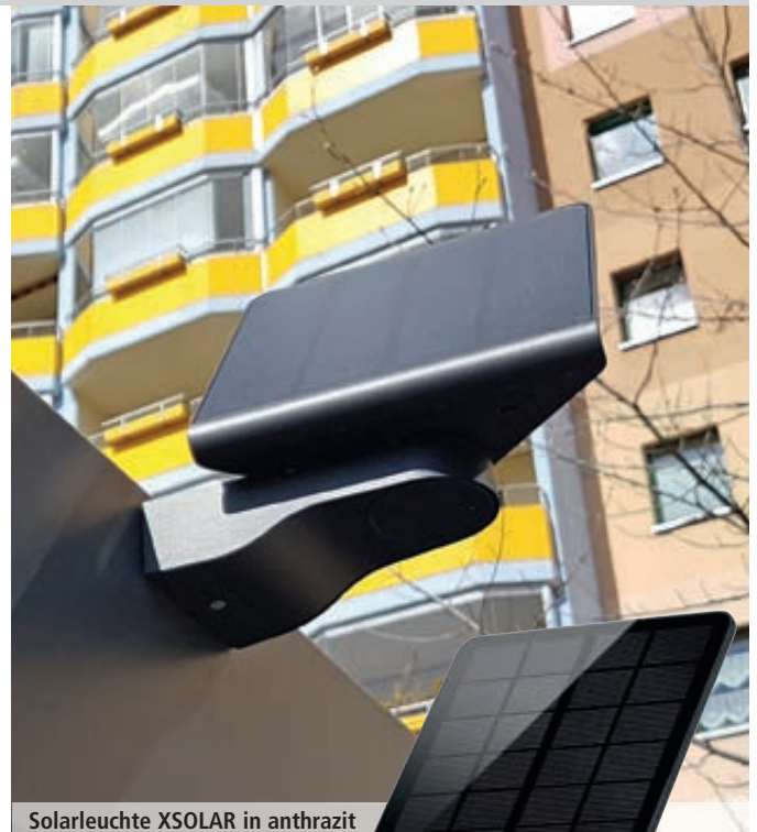
Solarleuchte XSOLAR in anthrazit