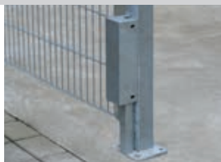
▲ Detail: Anschlusskasten mit Blechummantelung, feuerverzinkt