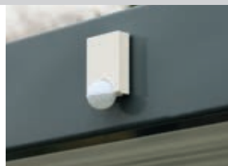
▲ Detail: Bewegungsmelder