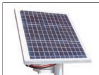
▲ Detail: Solar-Modul mit Gestell