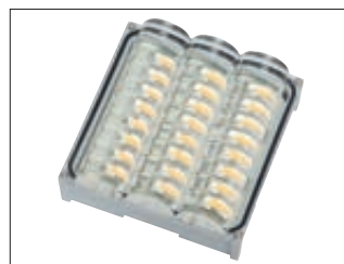
▲ Detail: LED-Modul