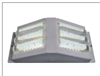
▲ Detail: Lampengehäuse inklusive LED-Modul