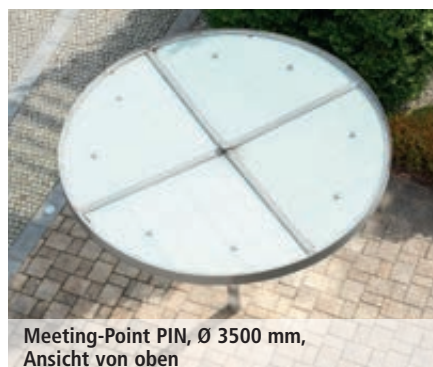
Meeting-Point PIN, Ø 3500 mm, Ansicht von oben