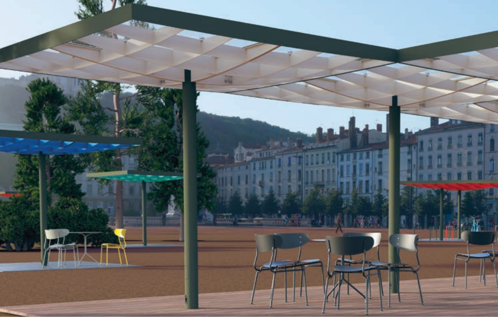
Meeting-Point PIN, quadratische Ausführung, 4 Stück Module, Dachbreite x Dachtiefe 9225 mm x 6150 mm, Stahlkonstruktion in RAL 6010 grasgrün / RAL 9010 reinweiß