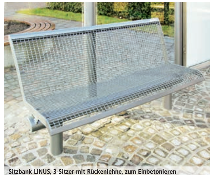
Sitzbank LINUS, 3-Sitzer mit Rückenlehne, zum Einbetonieren