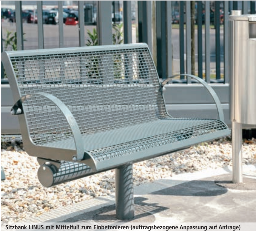
Sitzbank LINUS mit Mittelfuß zum Einbetonieren (auftragsbezogene Anpassung auf Anfrage)