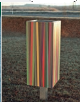
▲ Abfallbehälter NANUK, Korpus: Hochdrucklaminat