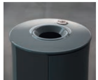
▲ Detail: Einwurfföffnung