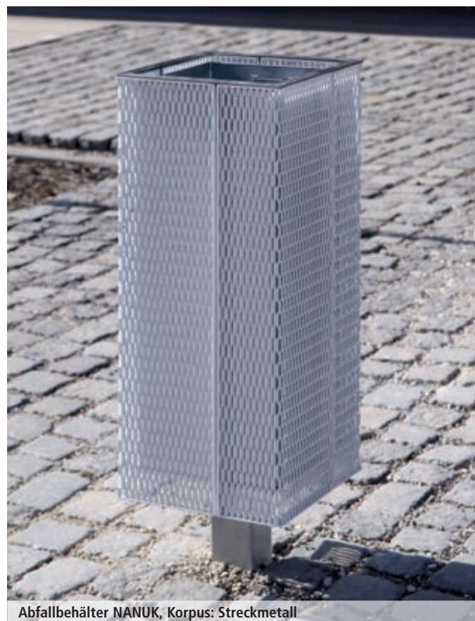
Abfallbehälter NANUK, Korpus: Streckmetall