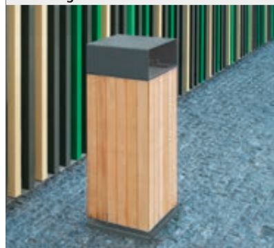
▲ Abfallbehälter NANUK, Standbehälter mit Schutzdach, Korpus: Robinienholzbelattung