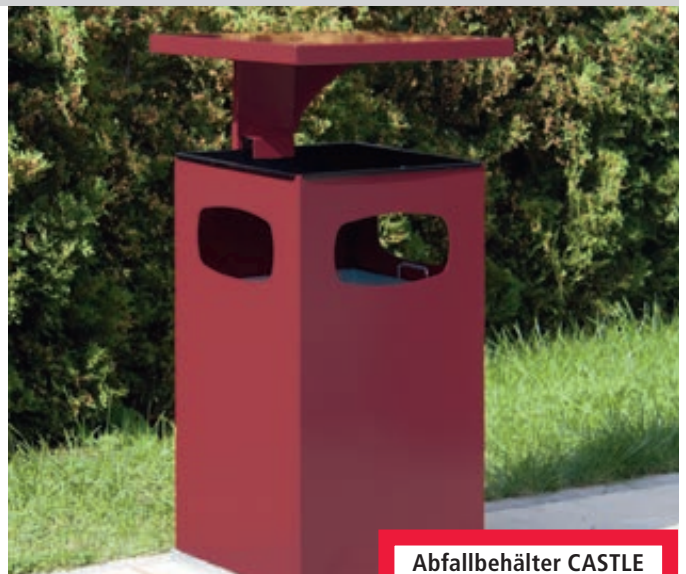
Abfallbehälter CASTLE mit Ascher, 72 Liter, in RAL 3004 purpurrot