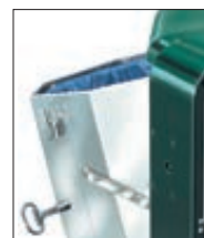
▲ Detail: Entleerung