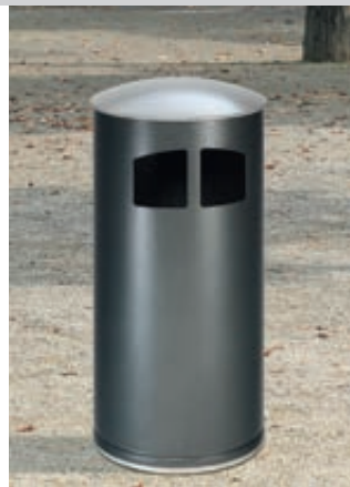
▲ Abfallbehälter MATANE, ohne Ascher, Korpus in antik-silber, Deckel in silber