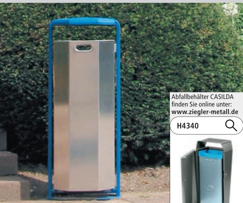
▲ Abfallbehälter KENT, Behälter aus Aluminium, Rahmen aus Stahl in RAL 5015 himmelblau

Behälter aus Aluminium - Rahmen aus Stahl - mit Schutzdach