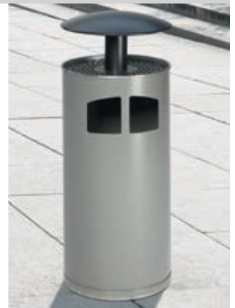
▲ Abfallbehälter MATANE, mit Ascher, Korpus in silber, Dach in antik-silber