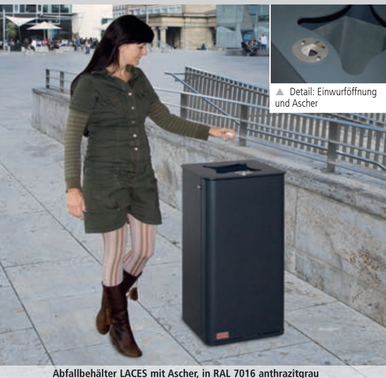
▲ Detail: Einwurfföffnung und Ascher