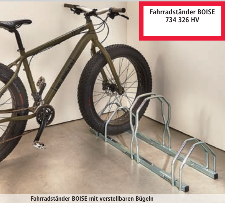
Fahrradständer BOISE 734 326 HV