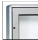
Detailansicht: Ecken gerundet Variante: Drehflügel

Konstruktion: Einseitig nutzbarer Aluminiumschaukasten wahlweise mit eckigen oder gerundeten Profilen. Bei kleineren Schaukasten-Formaten mit Drehflügel-Öffnung nach rechts, größere Formate mit Klappflügel-Öffnung nach oben. Klappflügel-Ausführung ausgestattet mit automatischer Feststellung des Flügels durch Gasdruckfeder. Rückwand magnethaftend. Schaukasten inkl. weißer Schriftblende (ohne Beschriftung) und Sicherheitsschlössern mit jeweils 2 Schlüsseln sowie mit integrierten Be- und Entlüftungsöffnungen gegen Beschlagen der Scheibe. Optional mit Rundrohr- oder Rechteckrohrständer und Beleuchtung lieferbar.