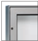
Detailansicht: Ecken spitz Variante: Drehflügel