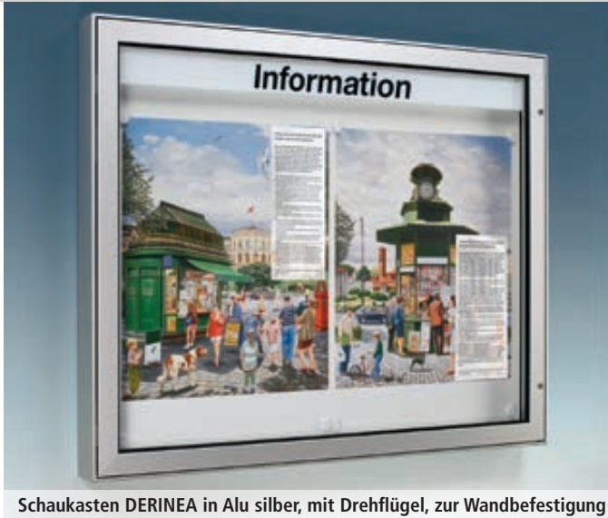
Schaukasten DERINEA in Alu silber, mit Drehflügel, zur Wandbefestigung