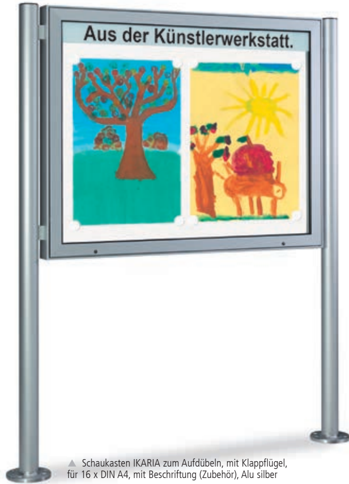
▲ Schaukasten IKARIA zum Aufdübeln, mit Klappflügel, für 16 x DIN A4, mit Beschriftung (Zubehör), Alu silber