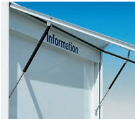
▲ Detail: Klappflügel inkl. Gasdruckfeder