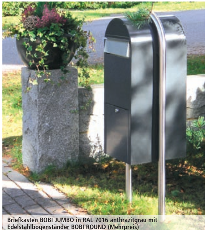
Briefkasten BOBI JUMBO in RAL 7016 anthrazitgrau mit Edelstahlbogenständer BOBI ROUND (Mehrpreis)