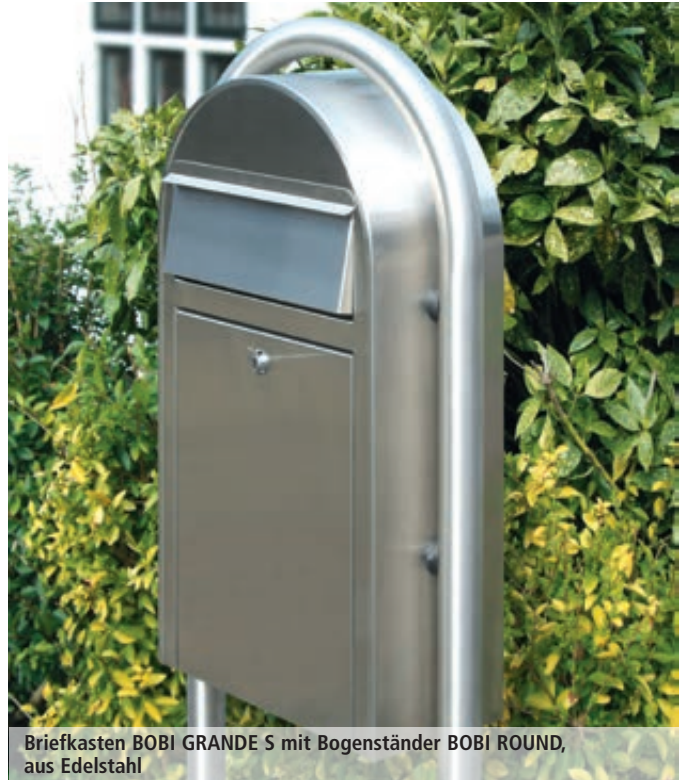
Briefkasten BOBI GRANDE S mit Bogenständer BOBI ROUND, aus Edelstahl