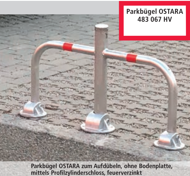
Parkbügel OSTARA 483 067 HV