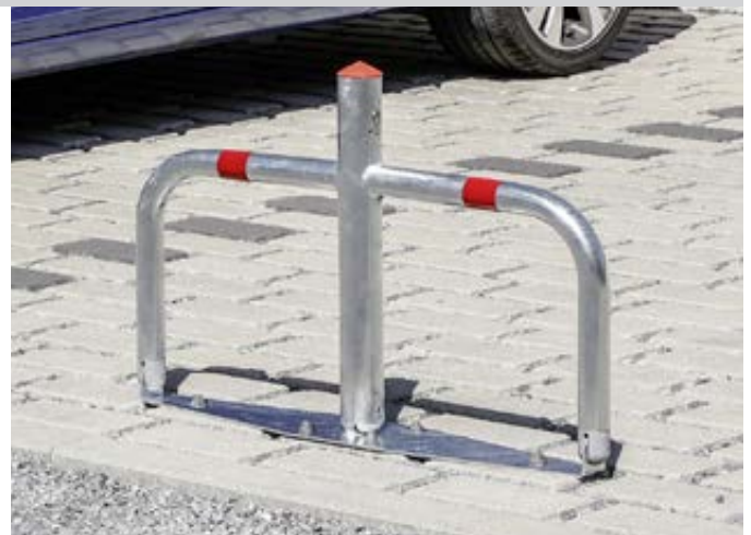
Parkbügel TELDE mit kurzem Mittelpfosten, zum Aufdübeln

Pro Parkbügel werden 6 Stück Fixanker benötigt.