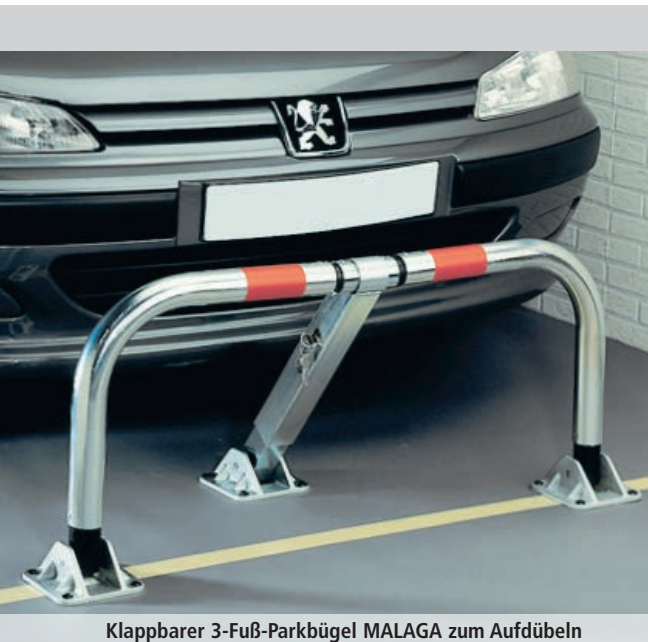
Klappbarer 3-Fuß-Parkbügel MALAGA zum Aufdübeln