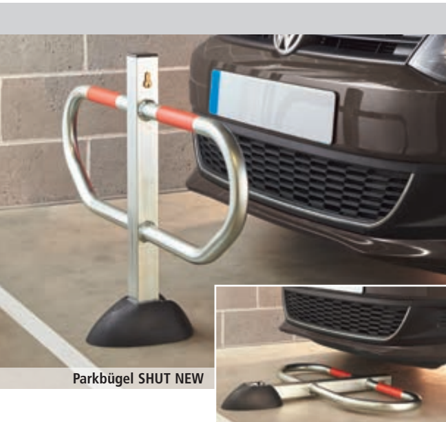
Parkbügel SHUT NEW