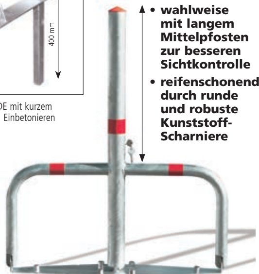
▶ Parkbügel TELDE mit langem Mittelpfosten