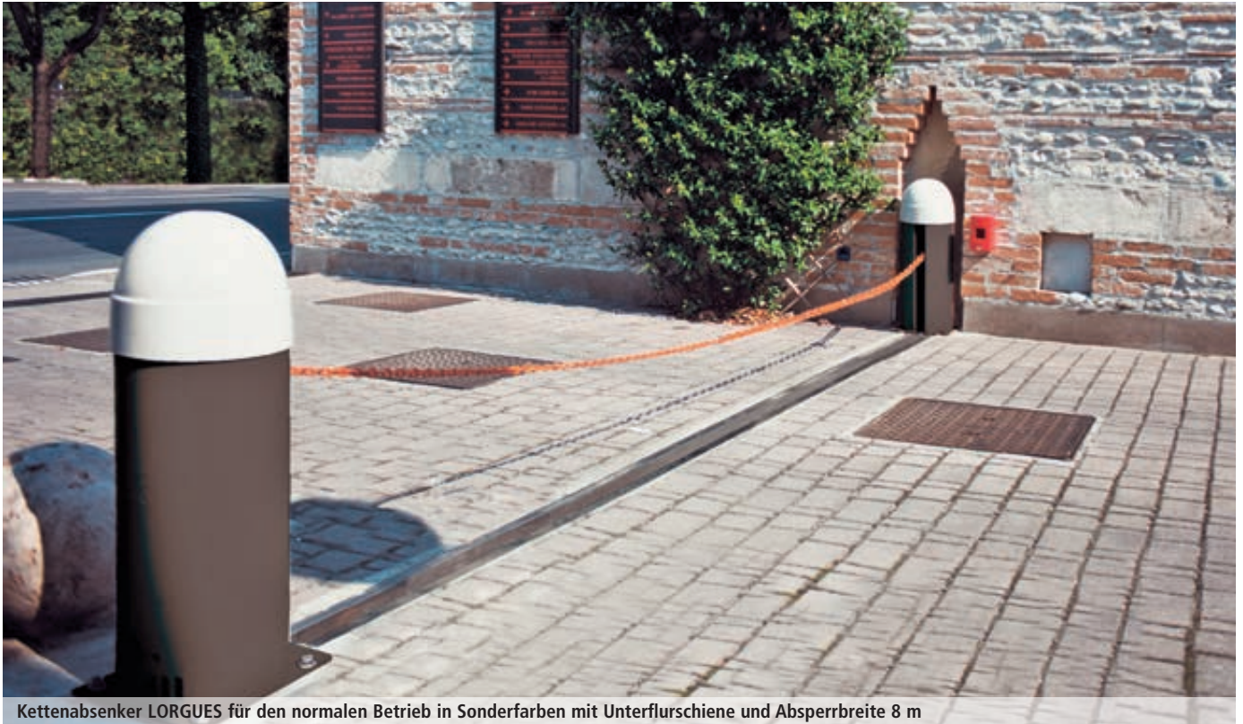
Kettenabsenker LORGUES für den normalen Betrieb in Sonderfarben mit Unterflurschiene und Absperrbreite 8 m