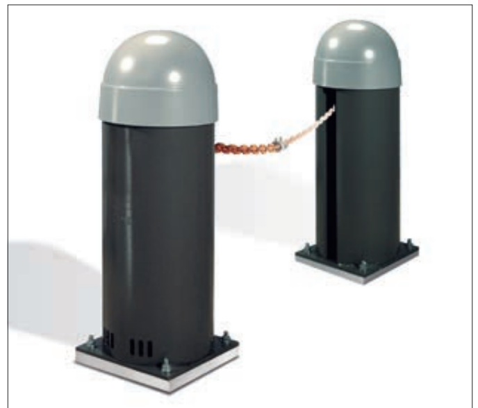
▲ Komplet-Set bestehend aus Säule mit integriertem Motor und Steuerung, Säule mit Gegengewicht und Abwickleinheit, Kette bis 8 m bzw. 16 m je Modell