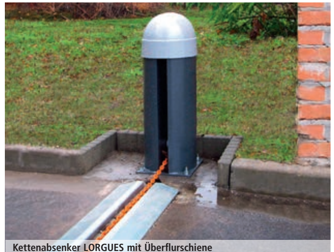
Kettenabsenker LOGQUES mit Überflurschiene

Schrankenanlage MONNES finden Sie auf den Seiten 560 - 561.