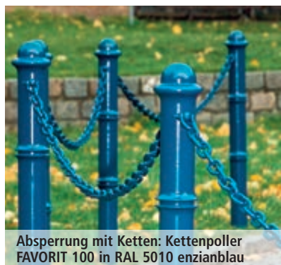
Absperrung mit Ketten: Kettenpoller FAVORIT 100 in RAL 5010 enzianblau