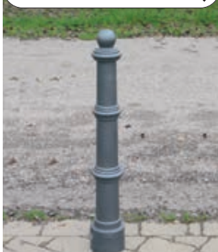
Poller FARO (3p-Technologie)