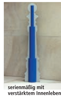
serienmäßig mit verstärktem Innenleben