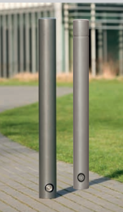
Poller JEREZ (3p-Technologie) ohne und mit Rille, Verriegelung mittels Sechskant- bzw. Dreikantschraube, in DB 703 eisenglimmer