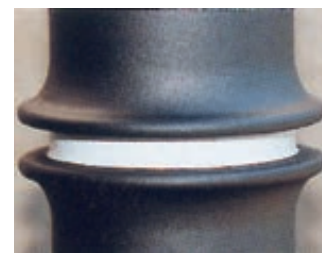
▲ reflektierende Folie