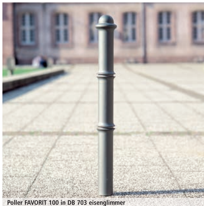
Poller FAVORIT 100 in DB 703 eisenglimmer

Befestigungshinweis: Zum Einbetonieren (empfohlene Einbautiefe 300 mm) bzw. zum Einbetonieren mit Bodenhülse (empfohlene Einbautiefe 500 mm).