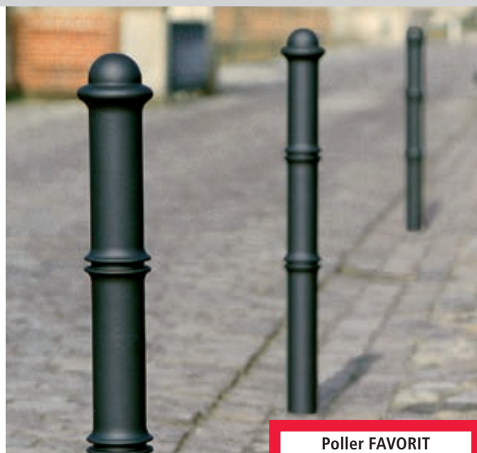
Poller FAVORIT 100 in RAL 7016 anthrazitgrau