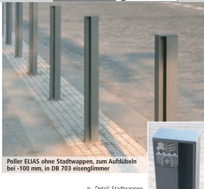
Poller ELIAS ohne Stadtwappen, zum Aufdübeln bei -100 mm, in DB 703 eisenglimmer