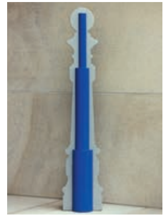
▲ serienmäßig mit verstärktem Innenleben

Befestigungsart: Zum Einbetonieren (empfohlene Einbautiefe 300 mm) bzw. zum Einbetonieren mit Bodenhülse (empfohlene Einbautiefe 500 mm).