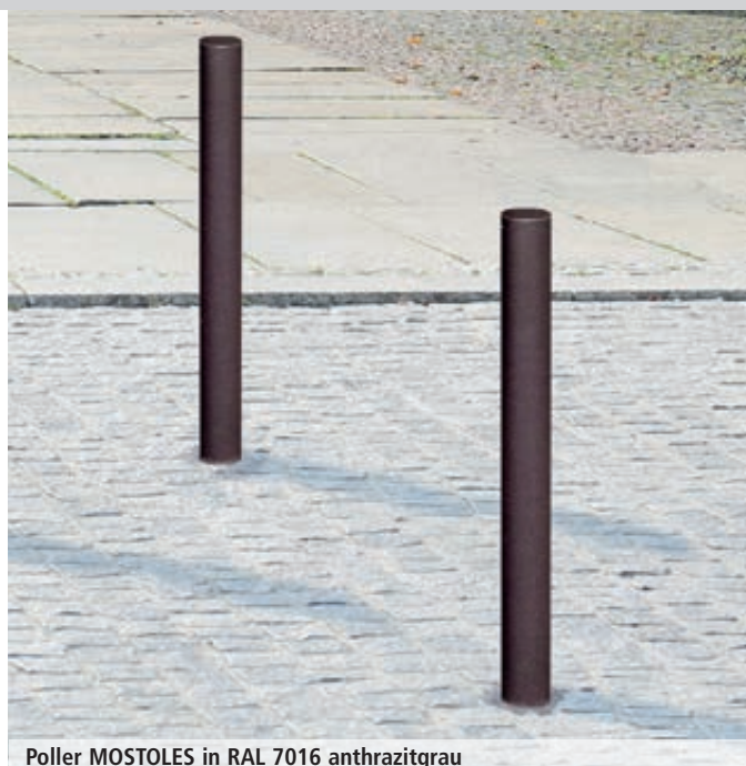
Poller MOSTOLES in RAL 7016 anthrazitgrau