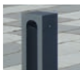
▲ Poller BARR mit Flachkopf

Die komplette Kollektion BARR finden Sie online unter: www.ziegler-metall.de K0055