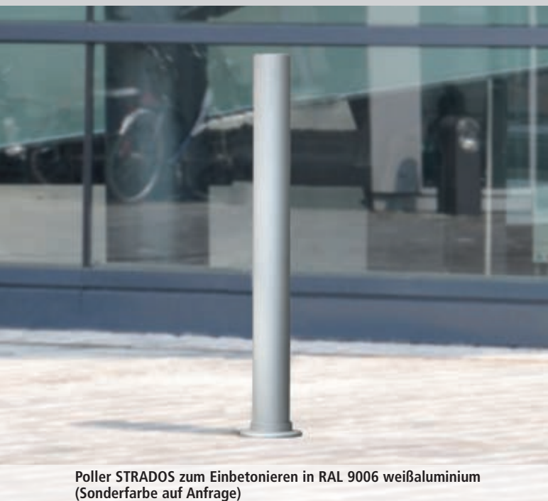
Poller STRADOS zum Einbetonieren in RAL 9006 weißaluminium (Sonderfarbe auf Anfrage)