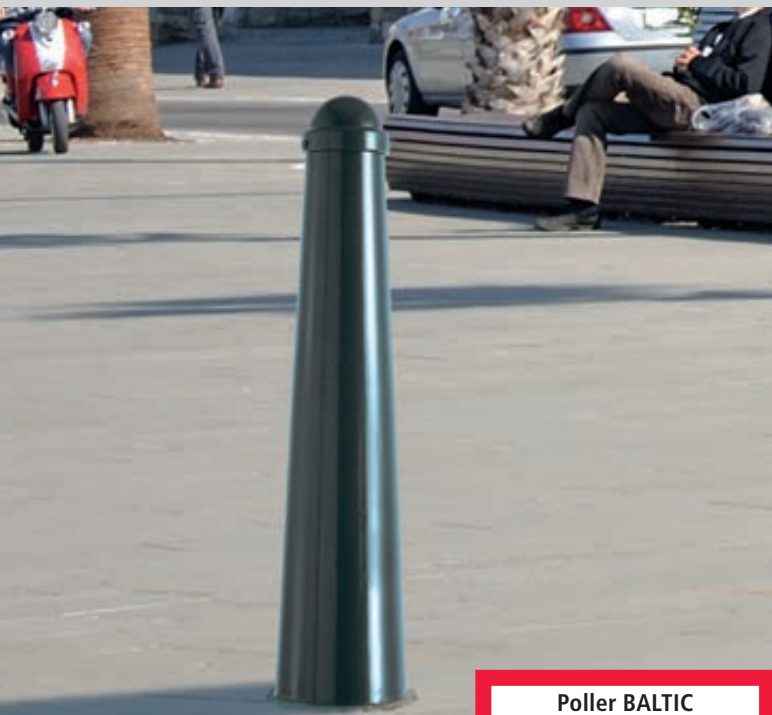
Poller BALTIC II in RAL 7016 anthrazitgrau