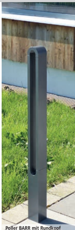
Poller BARR mit Rundkopf