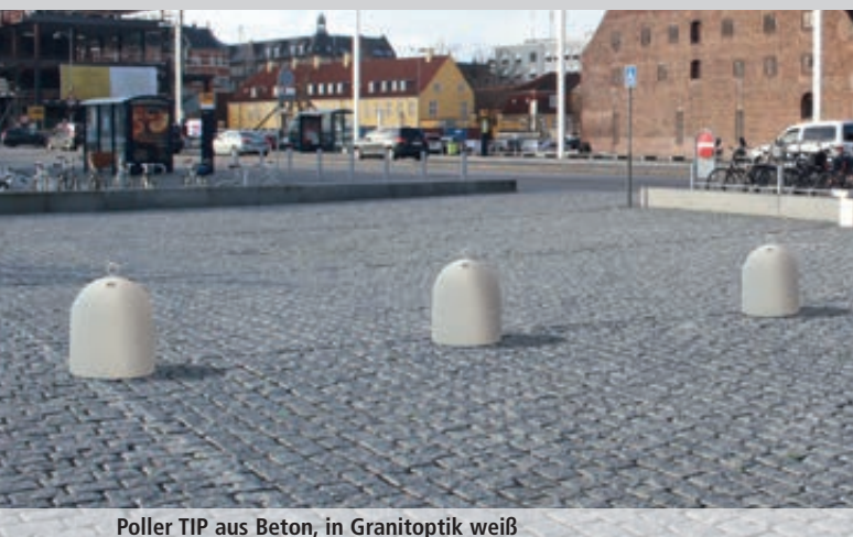
Poller TIP aus Beton, in Granitoptik weiß