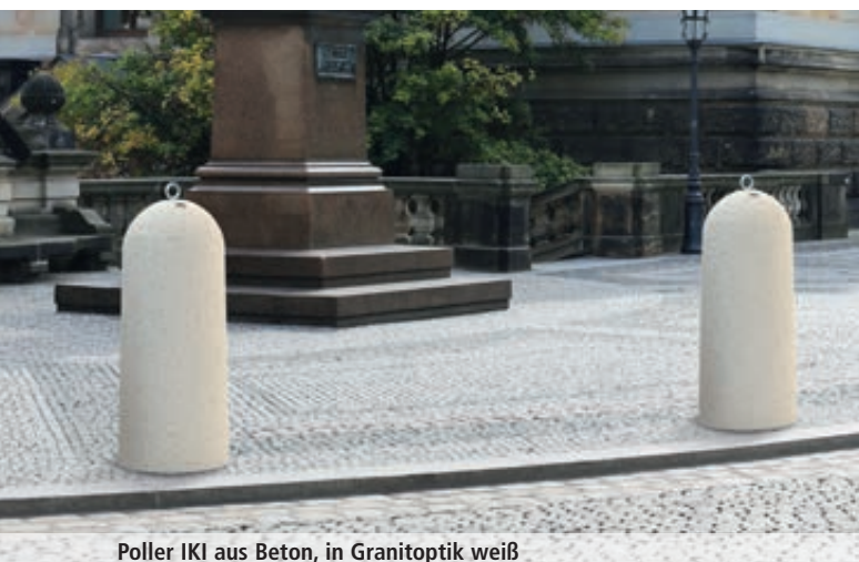
Poller IKI aus Beton, in Granitoptik weiß