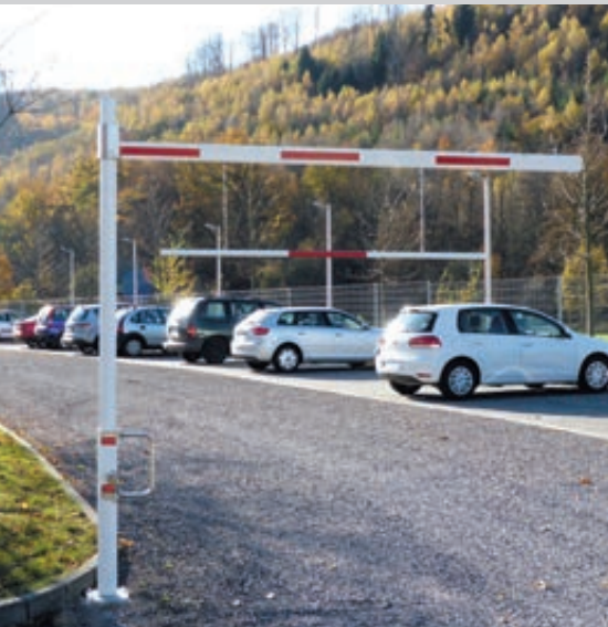
Höhenbegrenzungssperre RAUMO, drehbar, mit beweglicher Barriere, Sperrbreite 3,00 m

Konstruktion: Horizontal drehbare, alle 90° verriegelbare und ab 1000 mm stufenlos verstellbare Höhenbegrenzungssperre. Bestehend aus einer Hauptstütze aus Stahlrohr (Ø 102 mm), einem Drehbügel aus Edelstahl und einem Aluminium-Sperrbalken (86 x 46 mm) mit Antisitzschutz und Seilzugverstärkung. Lichte Durchfahrthöhe bis maximal 2800 bzw. 3800 mm. Barrierenabhängung aus Aluminium siehe Zubehör. Auf Anfrage mit Auflagstütze.