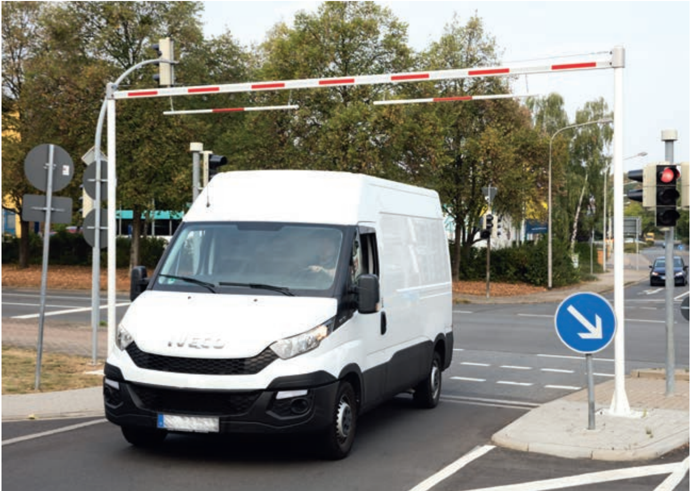
Höhenbegrenzungssperre VANTAA, Sperrbreite 7 m, weiß beschichtet mit roten Reflexstreifen, mit beweglichen Barriereabhängungen (Zubehör)