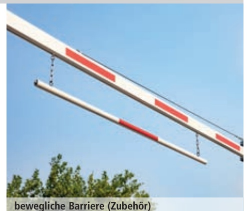
bewegliche Barriere (Zubehör)