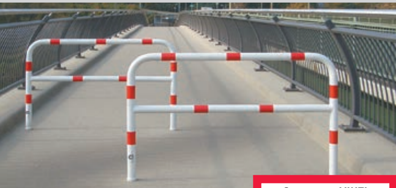
Sperrzaun VIHTI, verschließbar, feuerverzinkt und weiß pulverbeschichtet mit roten Reflexstreifen