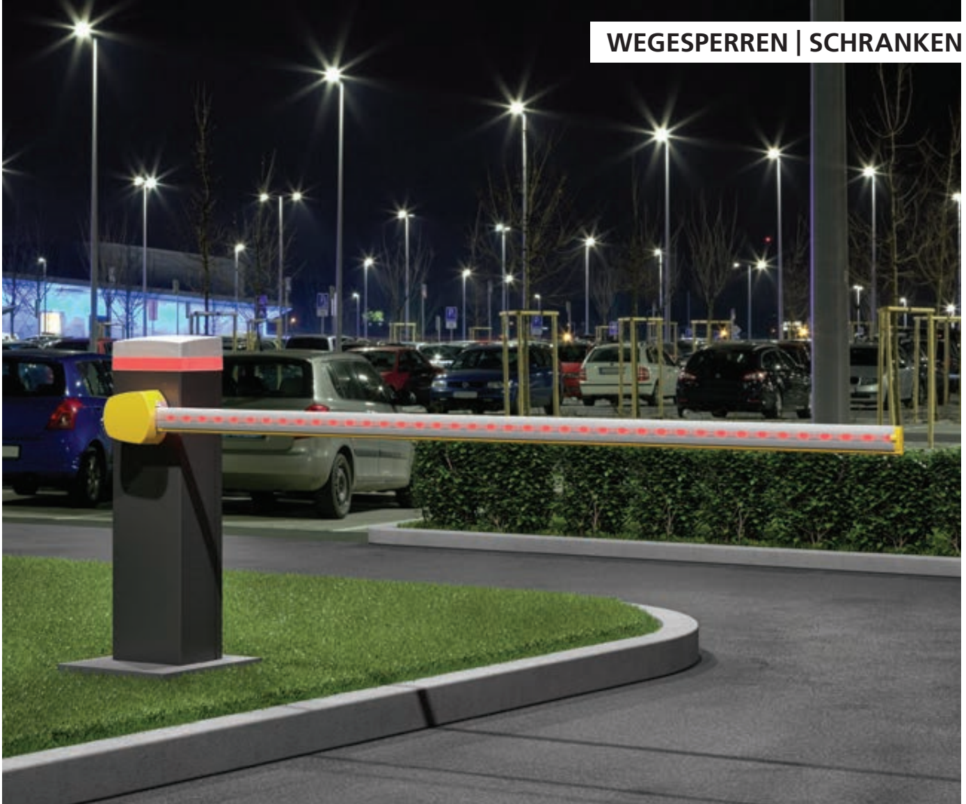
Schrankenanlage MONNES mit Absperrbreite 2,80 m für intensive Nutzung