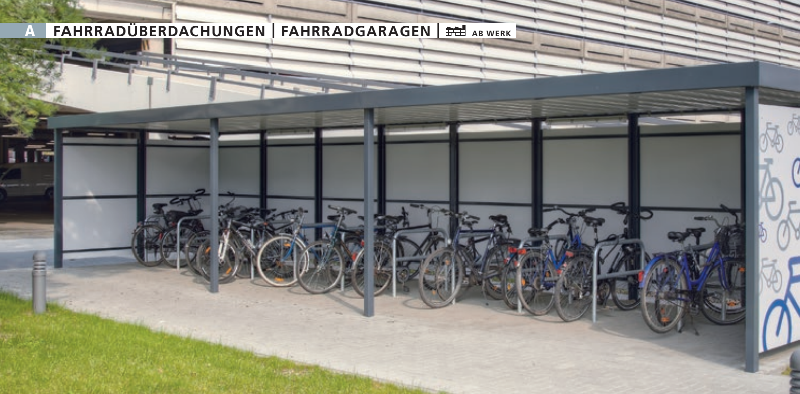
Fahrradüberdachung FLEXI-BOX, auftragsbezogene Anpassung, ca. Dachbreite x Dachtiefe 12300 mm x 3300 mm, Wandelemente Fassadenbautafeln Trespa® in wintergrau, Stahlkonstruktion in RAL 7016 anthrazitgrau