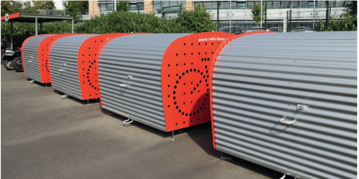
Fahrradgarage VELO-BOXX®-Professional mit Klappflügeltür aus Wellblech in RAL 9007 grau aluminium, Seitenwände in RAL 3000 feuerrot (auftragsbezogene Pulverbeschichtung)

Weitere Bilder, Informationen und Ausschreibungstexte: www.ziegler-metall.at