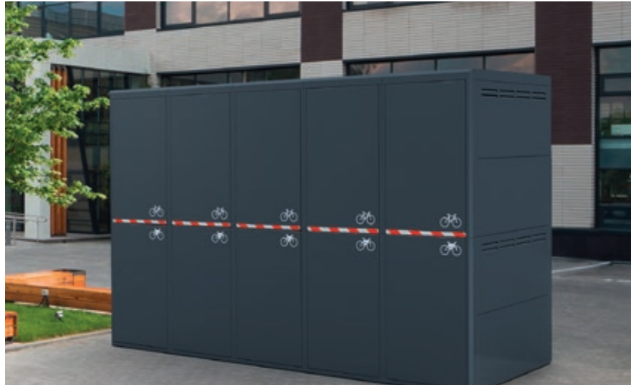
Fahrradgarage FULLERTON-E für 10 Fahrräder, doppelstöckig für elektrische Zugangssysteme, Höhe x Breite x Tiefe 2885 mm x 4483 mm x 2100 mm, mit Sicherheitsmarkierung, Stahlkonstruktion in RAL 7016 anthrazitgrau

Weitere Bilder, Informationen und Ausschreibungstexte: www.ziegler-metall.at