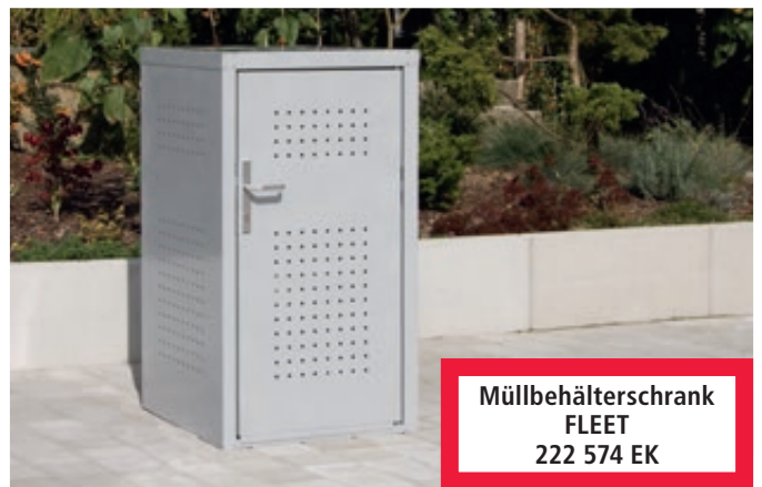
▲ Müllbehälter-Einzelschrank FLEET, in RAL 9006 weißaluminium, Tür mit Türdrücker außen und innen