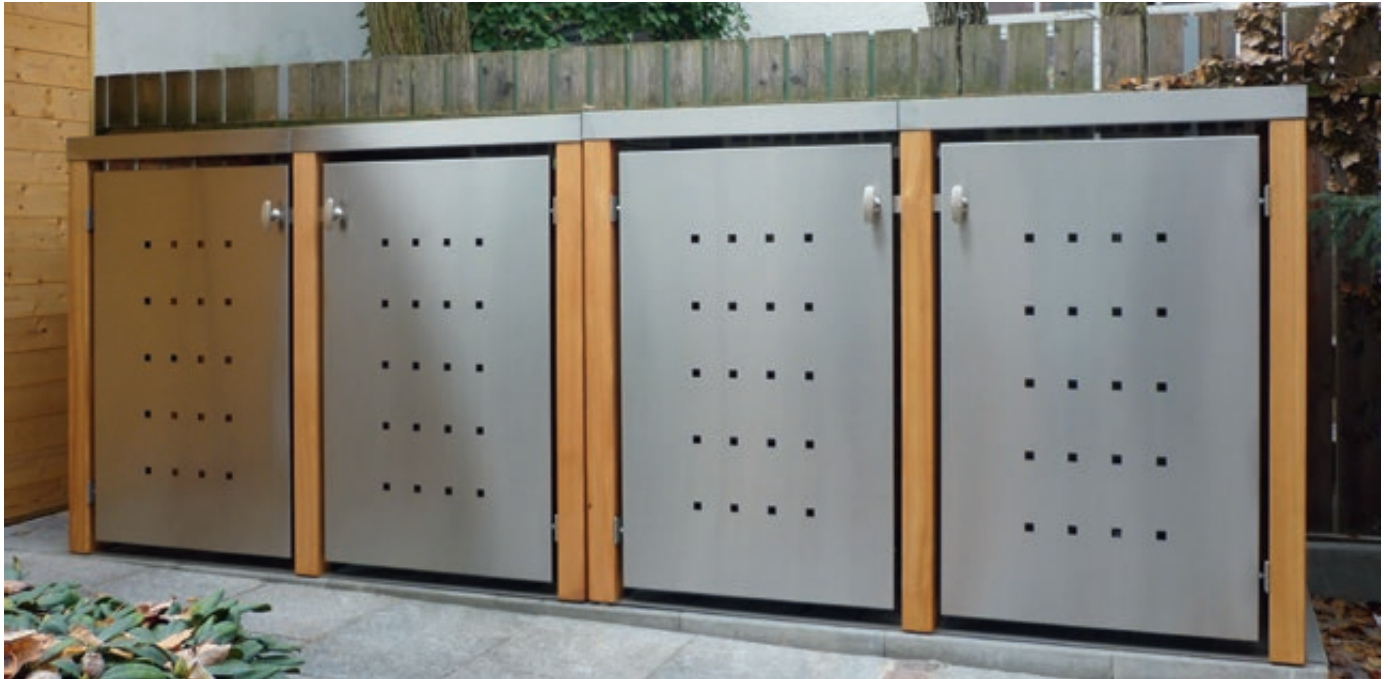
2x Müllbehälter-Doppelschrank FONTANA, Türen und Dach aus Edelstahl, Pfosten, Rück- und Seitenwandelemente aus Lärchenholz