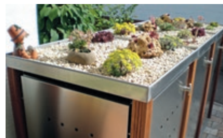
▲ Pflanzdach in Edelstahl mit bauseitiger Dachbegrünung