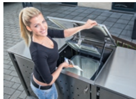
▲ Klappdach mit Gasdruckdämpfer