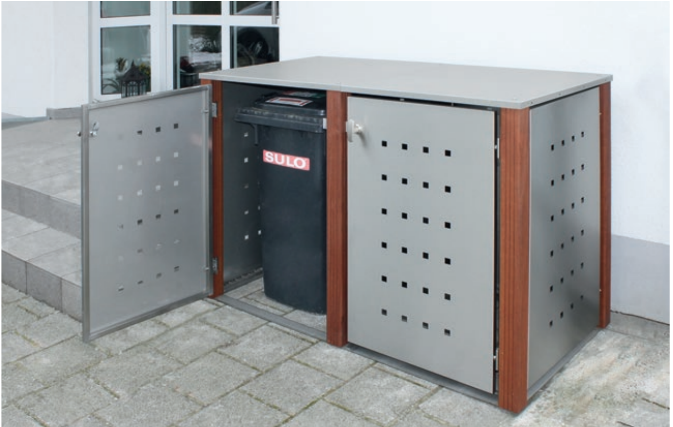
Müllbehälter-Doppelschrank GARLAND mit Flachdach, Türen, Dach, Rück- / Seitenwandelemente aus Edelstahl, Pfosten in Bangkiraiholz