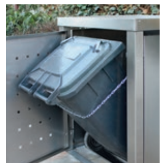
▲ Kippvorrichtung (Fangkette)