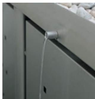
▲ Detail: Ablaufröhrchen nach außen (hinten)