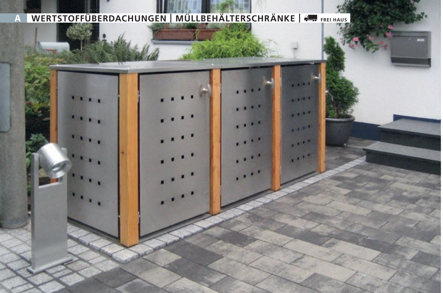
Müllbehälter-Dreifachschrank GARLAND mit Flachdach, Türen, Dach, Rück- / Seitenwandelemente aus Edelstahl, Pfosten in Lärchenholz