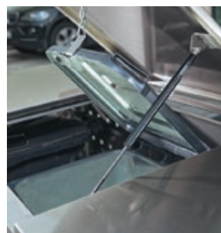
▲ Klappdach mit Gasdruckdämpfer