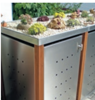
▲ Pflanzdach aus Edelstahl mit bauseitiger Dachbegrünung