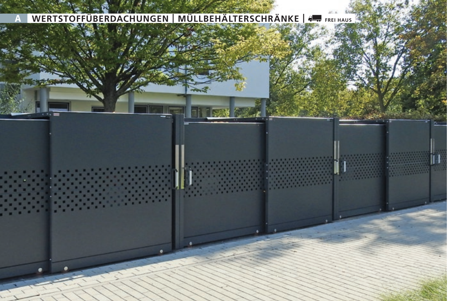
Müllbehälter-Doppelschrank STYLEOUT® QUBIS 1100 für 4-Rad-Abfallgroßbehälter, Schiebetüren mit Quadratlochung, Aluminiumkonstruktion in RAL 7016 anthrazitgrau