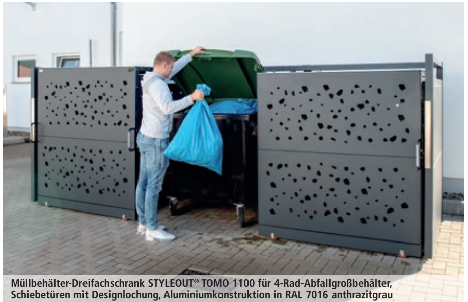
Müllbehälter-Dreifachschrank STYLEOUT® TOMO 1100 für 4-Rad-Abfallgroßbehälter, Schiebetüren mit Designlochung, Aluminiumkonstruktion in RAL 7016 anthrazitgrau