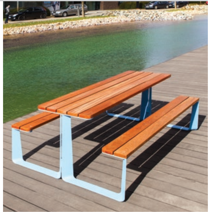
Bank-Tisch-Kombination RAUTSTER, doppelseitig, mit Jatobaholzbelattung, Stahlteile in RAL 5024 pastellblau