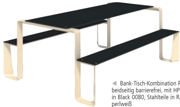
◀ Bank-Tisch-Kombination RAUTSTER, beidseitig barrierefrei, mit HPL-Auflage in Black 0080, Stahlteile in RAL 1013 perlweiß

Weitere Ausführungen finden Sie online unter: www.ziegler-metall.at