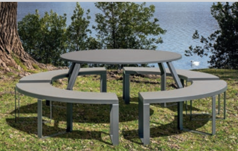
Bank-Tisch-Kombination SEMPREVERDE, Stahlteile in RAL 7024 graphitgrau

Standardfarben - bitte bei Bestellung Farbe angeben!