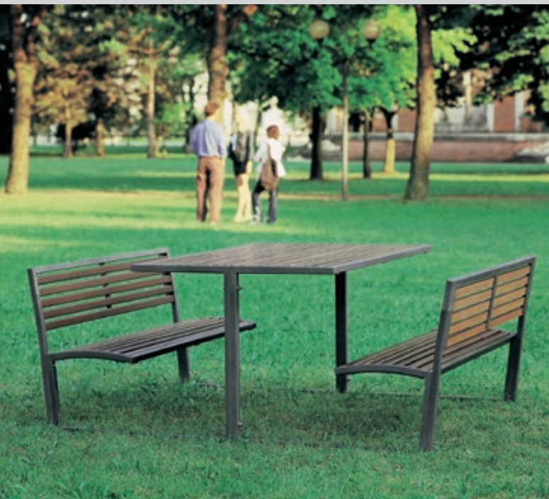
Bank-Tisch-Kombination CAMILLA, mit Hartholzbelattung, Stahlteile in RAL 7016 anthrazitgrau

Konstruktion: Tisch und Sitzbänke sind konstruktiv fest miteinander verbunden. Die gesamte Konstruktion ist 2-teilig verschraubt und besteht aus 30 x 30 mm Quadratrohr. Tisch- und Sitzfläche sowie Rückenlehne mit Holzbelattung.