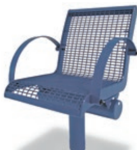
▲ 1-Sitzer LINUS mit Rückenlehne und beidseitig Armlehnen, in RAL 5002 ultramarinblau