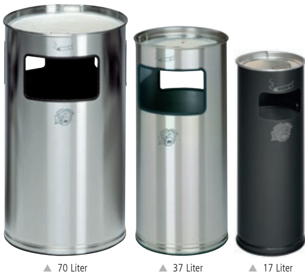
▲ 70 Liter