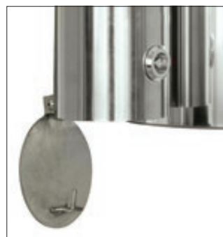
▲ Detail: geöffnete Bodenklappe vom Ascher