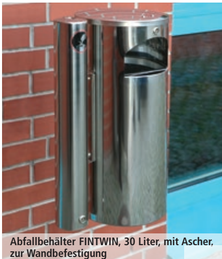
Abfallbehälter FINTWIN, 30 Liter, mit Ascher, zur Wandbefestigung