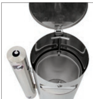
▲ Detail: Abfallbehälter geöffnet