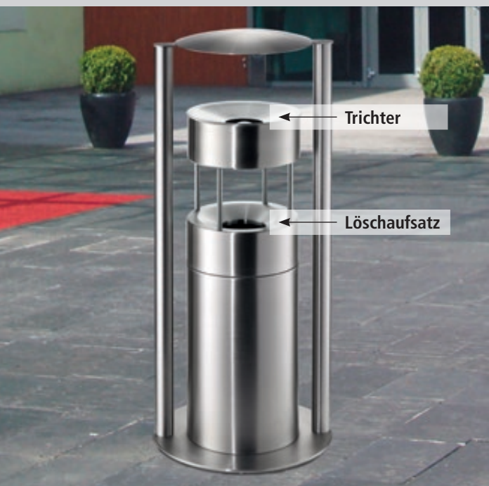
Abfallbehälter QUEEN mit Ascher, zum Aufdübeln, Abfallbehälter mit Löschaufsatz, Ascher mit Trichter