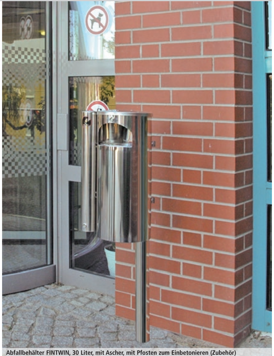
Abfallbehälter FINTWIN, 30 Liter, mit Ascher, mit Pfosten zum Einbetonieren (Zubehör)