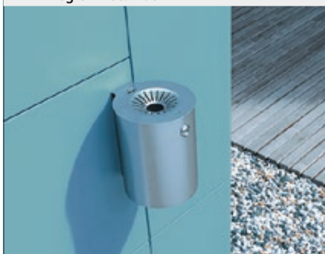
Wandascher M2 aus Edelstahl