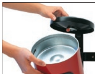
◀ Entleerung vom Abfallbehälter GLASGOW mit Ascher, in RAL 3001 signalrot, zur Wandbefestigung