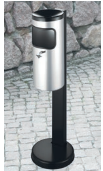
▲ Abfallbehälter GLASGOW mit Ascher, in weißaluminium ähnlich RAL 9006, mit Standfuß zum freien Aufstellen (Zubehör)