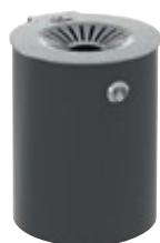
Wandascher M2 in RAL 7016 anthrazit