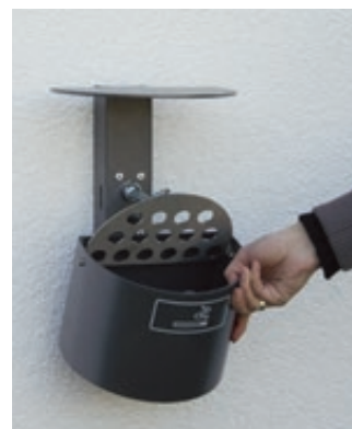
▲ Entleerung von Halbrundascher KERRY mit Schutzdach, Wandbefestigung, in DB 703 eisenglimmer