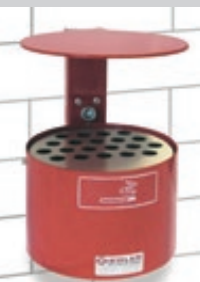
▲ Rundascher KERRY mit Schutzdach, Wandbefestigung, in RAL 3002 karminrot