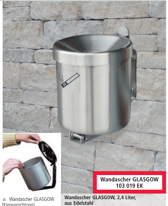
Wandascher GLASGOW 103 019 EK