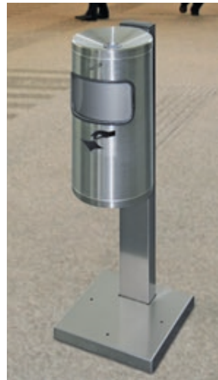
▲ Abfallbehälter GLASGOW mit Ascher, aus Edelstahl, mit Standfuß zum Aufdübeln (Zubehör)