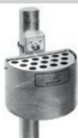
▲ Halbrundascher KERRY, befestigt an Pfosten (Zubehör), feuerverzinkt

Konstruktion: Rund- bzw. Halbrundascher aus Stahlblech mit Edelstahl-Sieb bzw. komplett aus Edelstahl, wahlweise mit Schutzdach. Mit Wasserablauf. Lieferung inkl. Piktogramm-Aufkleber „Zigarette“.