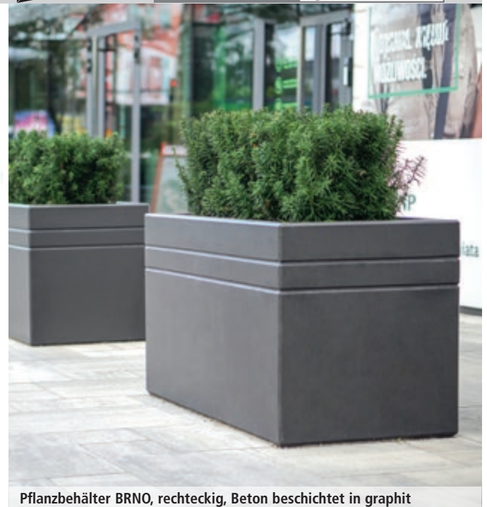
Pflanzbehälter BRNO, rechteckig, Beton beschichtet in graphit