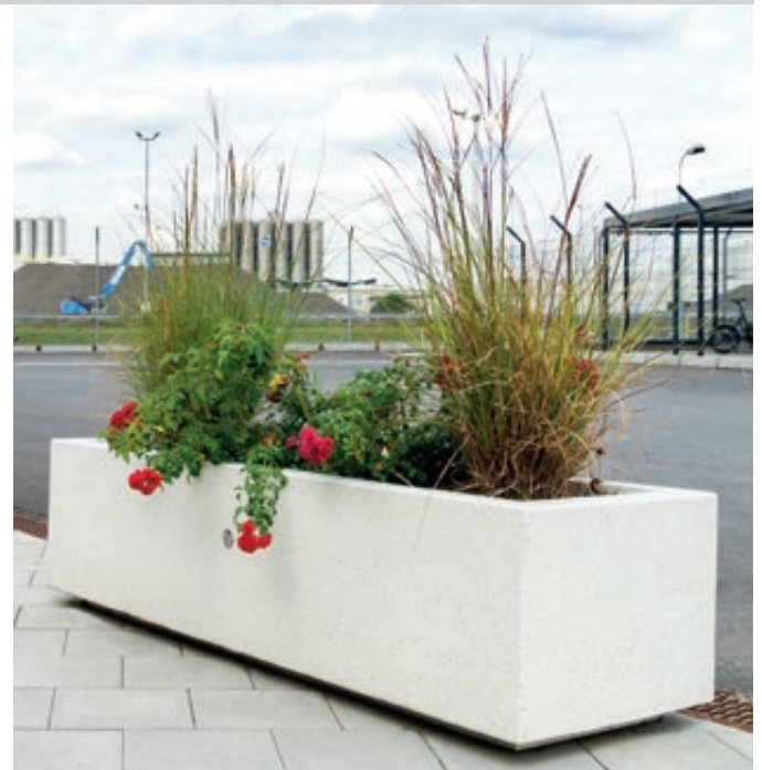
▲ Pflanzbehälter DEMETRA aus Beton, in Granitoptik weiß