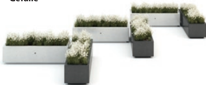
▲ Pflanzbehälter DEMETRA aus Beton, in Granitoptik weiß und aus rekonstituiertem Marmor, in schwarz ebano