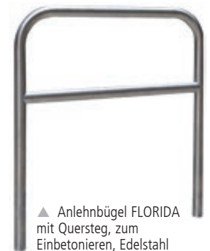
▲ Anlehnbügel FLORIDA mit Quersteg, zum Einbetonieren, Edelstahl