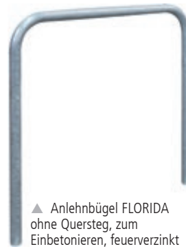
▲ Anlehnbügel FLORIDA ohne Quersteg, zum Einbetonieren, feuerverzinkt