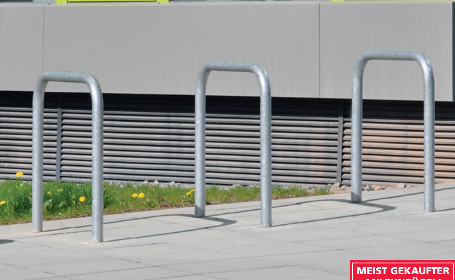
Anlehnbügel FLORIDA ohne Quersteg, zum Einbetonieren, feuerverzinkt