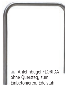
▲ Anlehnbügel FLORIDA ohne Quersteg, zum Einbetonieren, Edelstahl