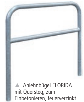
▲ Anlehnbügel FLORIDA mit Quersteg, zum Einbetonieren, feuerverzinkt