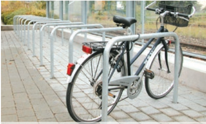
Anlehnbügel FLORIDA ohne Quersteg, zum Einbetonieren, feuerverzinkt