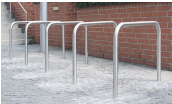
Anlehnbügel FLORIDA ohne Quersteg, zum Einbetonieren, Edelstahl