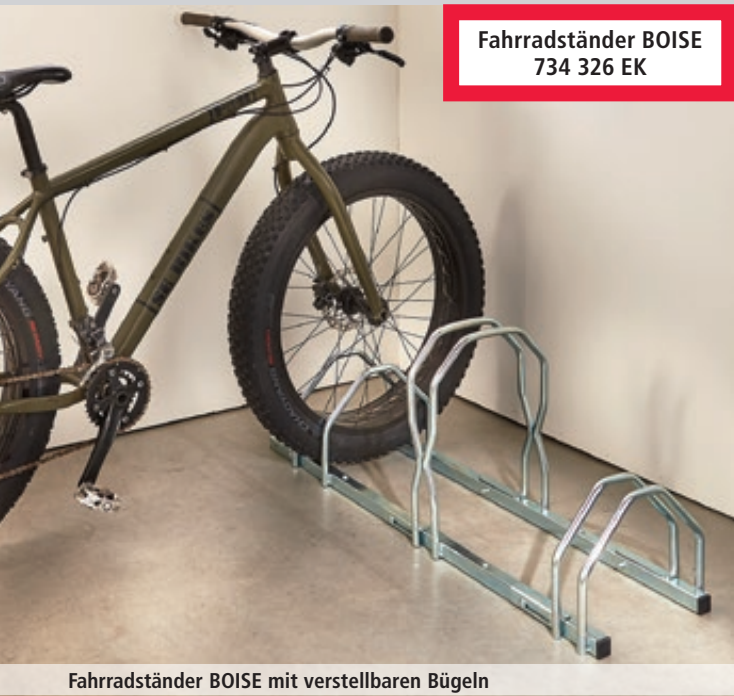
Fahrradständer BOISE 734 326 EK