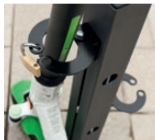
▲ Detail: Lenkersicherung, Ausführung 2 Stellplätze