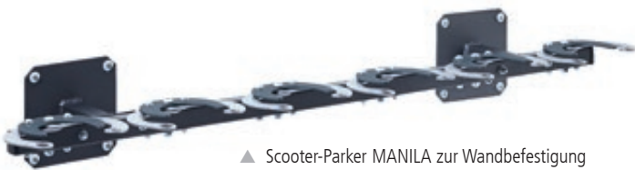
▲ Scooter-Parker MANILA zur Wandbefestigung