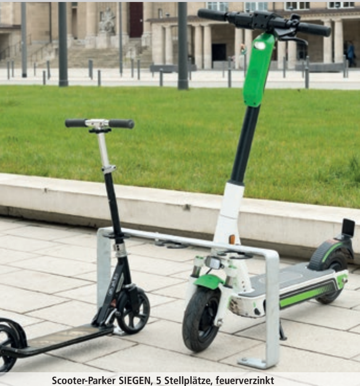
Scooter-Parker SIEGEN, 5 Stellplätze, feuerverzinkt

Konstruktion: Scooter-Parker mit 5 Stellplätzen aus gebogenem Flachstahl (10 x 70 mm) bzw. mit 2 Stellplätzen aus einer quadratischen Säule aus Stahl (80 x 80 mm) inkl. Lenkerhalterung und Diebstahlsicherung. Sicherung erfolgt durch 2 halbrunde und bewegliche Stahlplatten, welche den Lenker des Scooters umschließen und mit einem Schloss gesichert werden können (Innen-Ø 60 mm, Außen-Ø 120 mm).