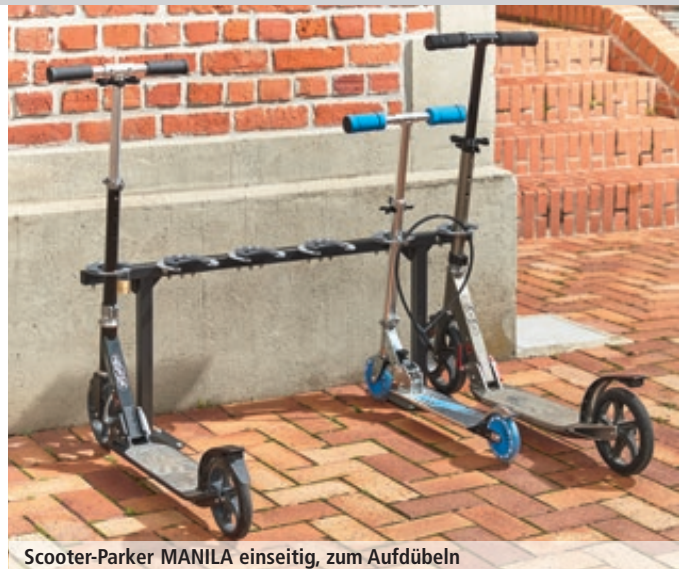
Scooter-Parker MANILA einseitig, zum Aufdübeln