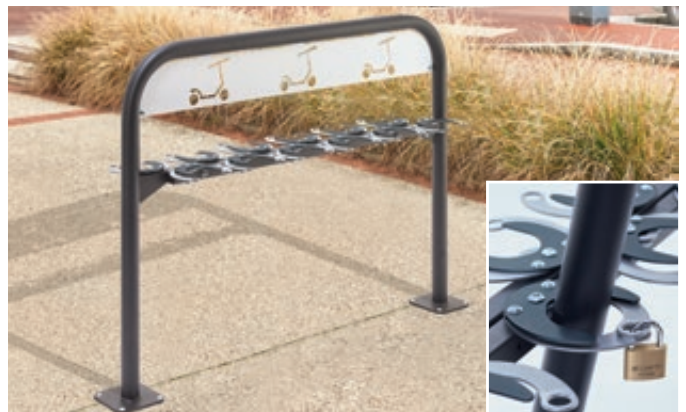
Scooter-Parker MANILA doppelseitig, zum Aufdübeln