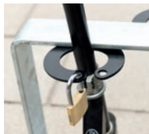
▲ Detail: Lenkersicherung, Ausführung 5 Stellplätze