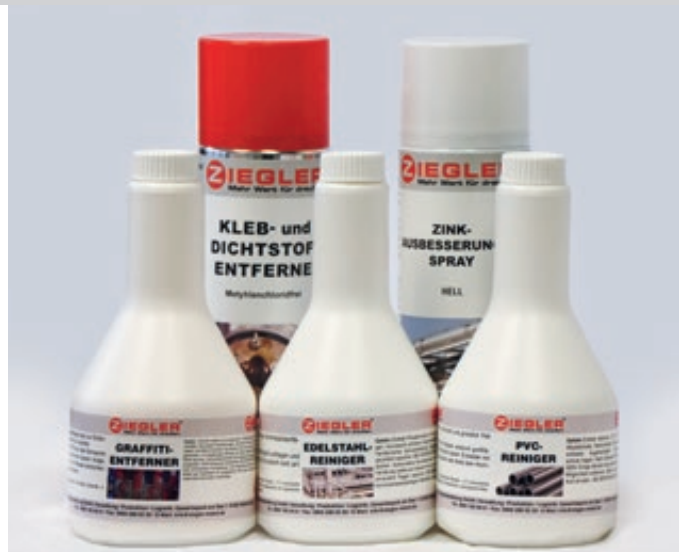
Graffiti-entferner, Edelstahlreiniger, PVC-Reiniger, Dicht- und Klebstoffentferner sowie Zinkausbesserungsspray hell

Graffiti-entferner: Zur Entfernung von Spraylacken auf Metallen, Glas, Keramik sowie harten Kunststoffen (flüssig und CKW-frei).