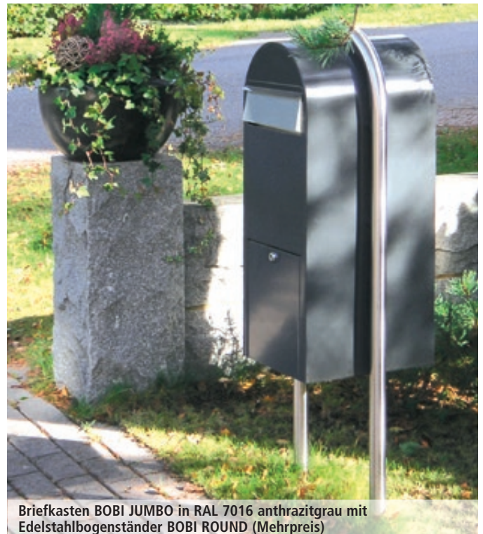
Briefkasten BOBI JUMBO in RAL 7016 anthrazitgrau mit Edelstahlbogenständer BOBI ROUND (Mehrpreis)