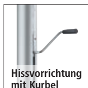
Hissvorrichtung mit Kurbel

LED-Fahnenmast APPEAR finden Sie online unter: www.ziegler-metall.at