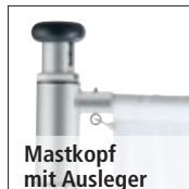
Mastkopf mit Ausleger