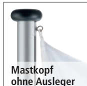
Mastkopf ohne Ausleger

Befestigungsart: Zum Einbetonieren, Bodenkipphalterung im Lieferumfang enthalten (empfohlene Einbautiefe 700 mm).