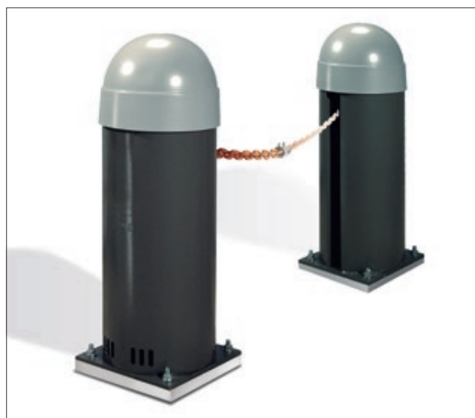
▲ Komplet-Set bestehend aus Säule mit integriertem Motor und Steuerung, Säule mit Gegengewicht und Abwickleinheit, Kette bis 8 m bzw. 16 m je Modell