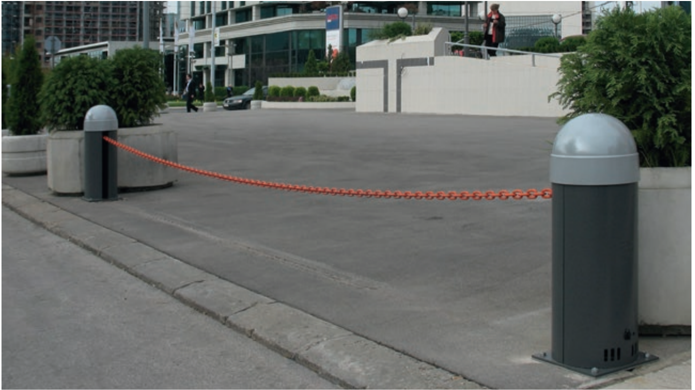
Kettenabsenker LORGUES, in RAL 7016 anthrazitgrau, Pollerkopf in RAL 7035 lichtgrau, Absperrbreite 8 m