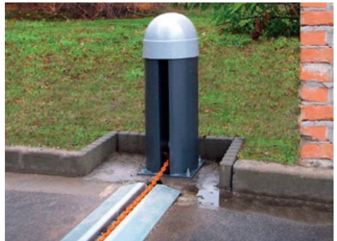
Kettenabsenker LORGUES mit Überflurschiene

*Für den Einbau dieser Bedienelemente wird eine Bediensäule benötigt.