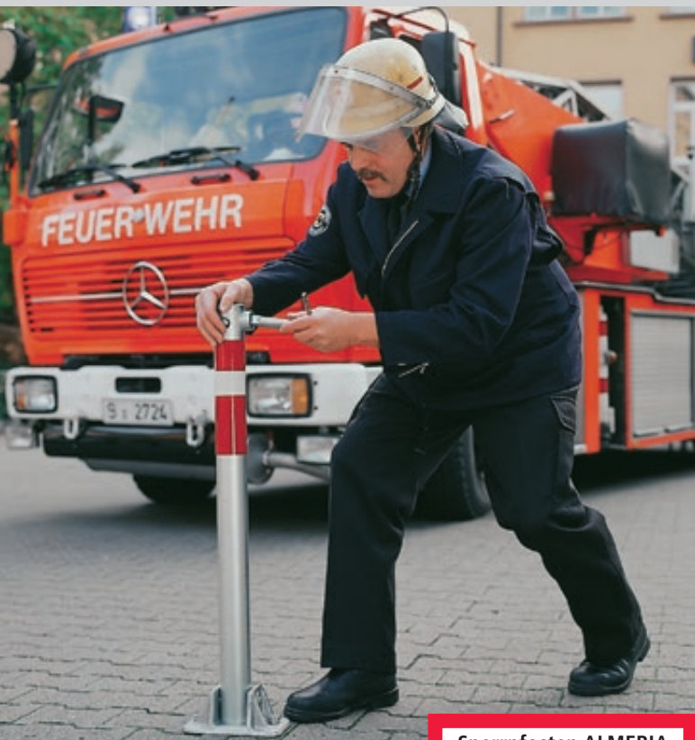
Sperrpfosten ALMERIA zum Aufdübeln, beidseitig kippbar