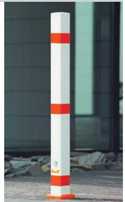
▲ Sperrpfosten CADIZ feuerverzinkt und weiß pulverbeschichtet, mit Abschlusskappe aus Stahl