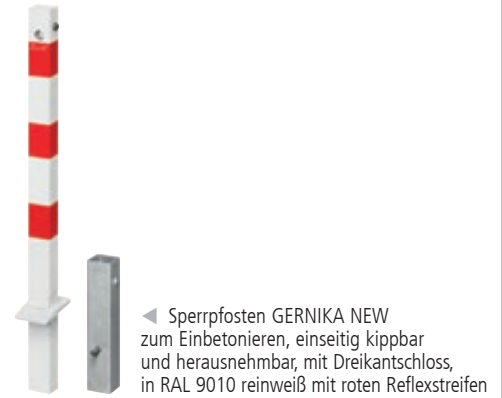
◀ Sperrpfosten GERNIKA NEW zum Einbetonieren, einseitig kippbar und herausnehmbar, mit Dreikantschloss, in RAL 9010 reinweiß mit roten Reflexstreifen

*Bei herausnehmbaren Sperrpfosten mit Kippfunktion wird zwingend ein Universalschlüssel benötigt.