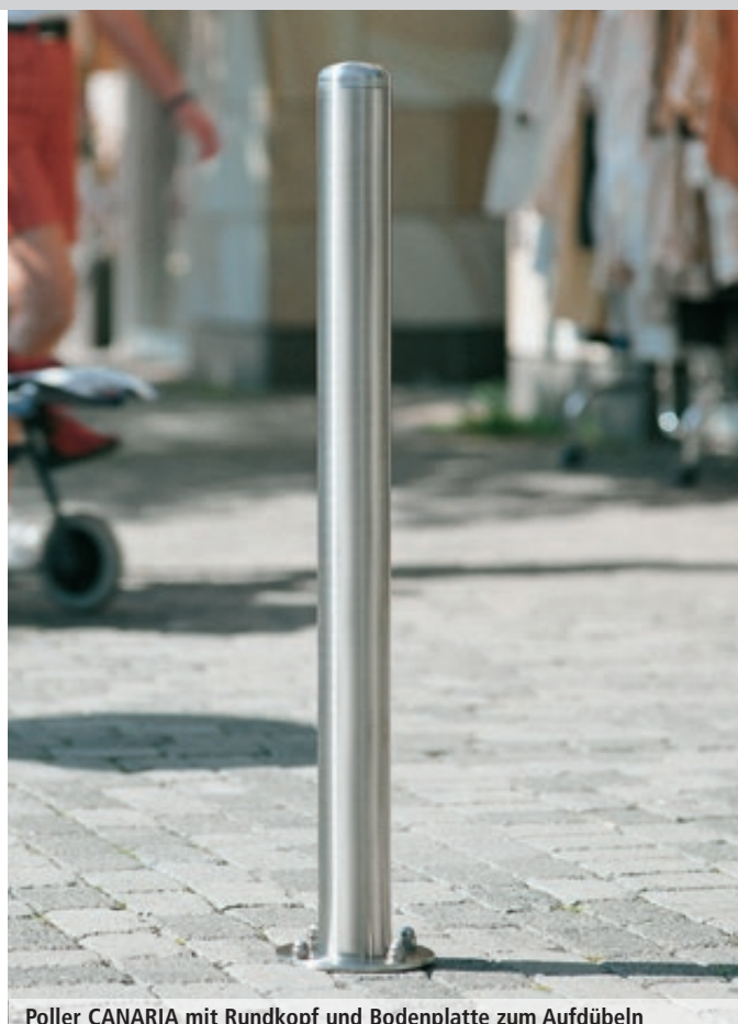
Poller CANARIA mit Rundkopf und Bodenplatte zum Aufdübeln