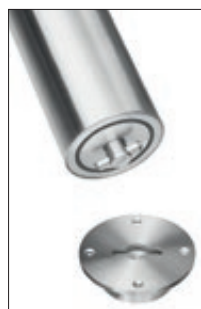
▲ Poller drehen und verschließen