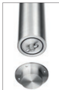
▲ Poller in Bodenhülse einsetzen