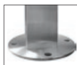
▲ Detail: Bodenplatten-Ø 165 mm