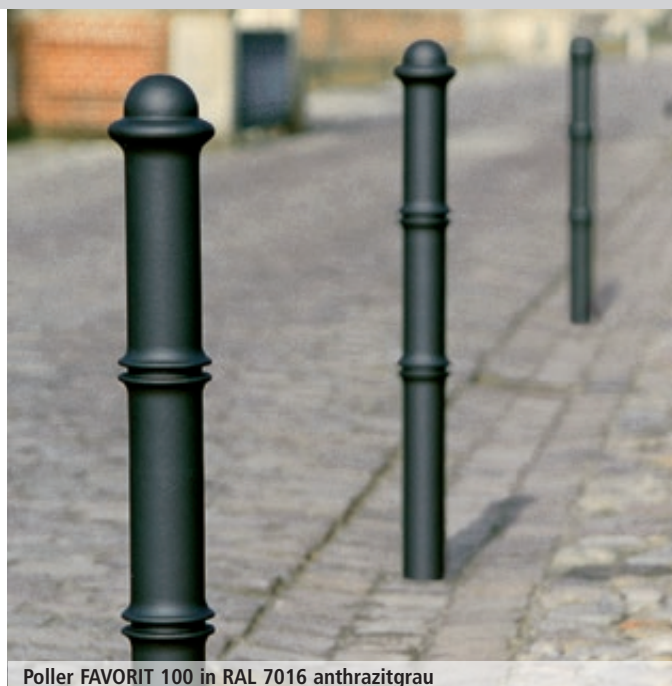
Poller FAVORIT 100 in RAL 7016 anthrazitgrau