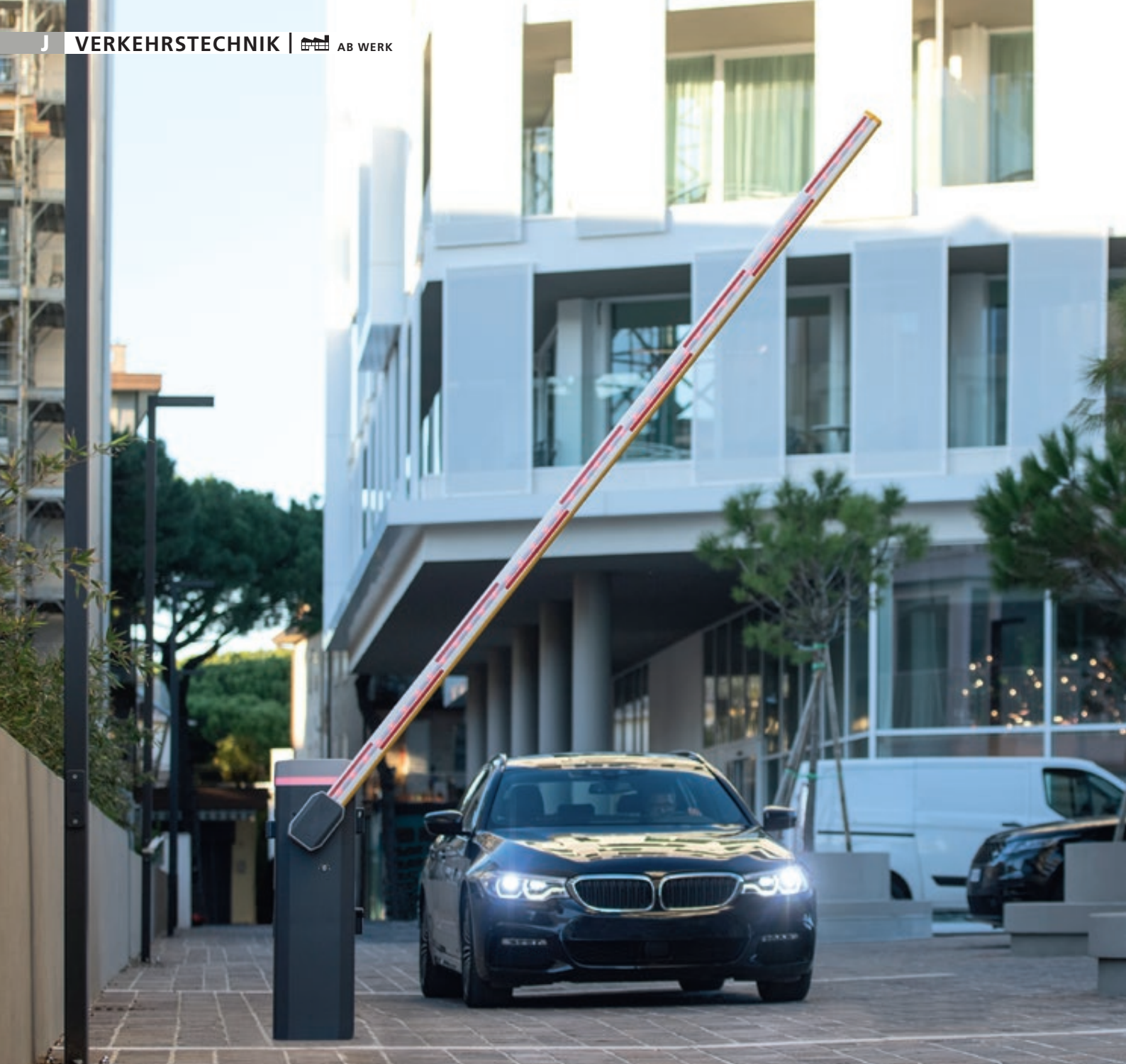
Schrankenanlage BUSSET, Absperrbreite 4,00 m, mit LED-Schrankenbaumbeleuchtung (Zubehör)