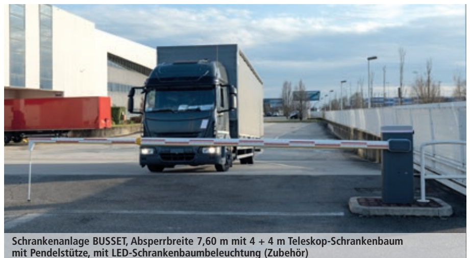
Schrankenanlage BUSSET, Absperrbreite 7,60 m mit 4 + 4 m Teleskop-Schrankenbaum mit Pendelstütze, mit LED-Schrankenbaumbeleuchtung (Zubehör)