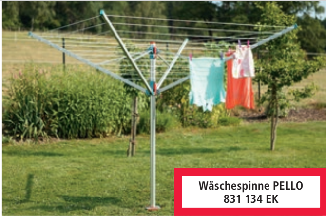
Wäschespinne PELLO 831 134 EK