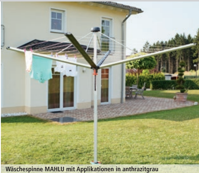
Wäschespinne MAHLU mit Applikationen in anthrazitgrau