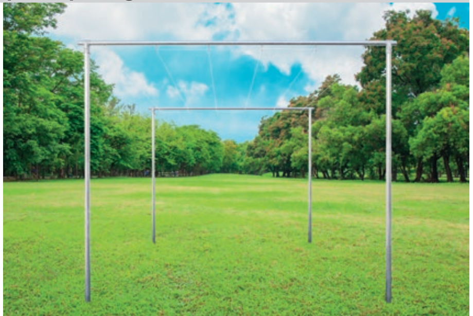
Gerüst mit Wäschestange NAJAK, feuerverzinkt

Standardfarben für Wäschegerüst MAUBEC und Gerüst mit Wäsche- bzw. Teppichklopfstange NAJAK - bitte bei Bestellung Farbe angeben!