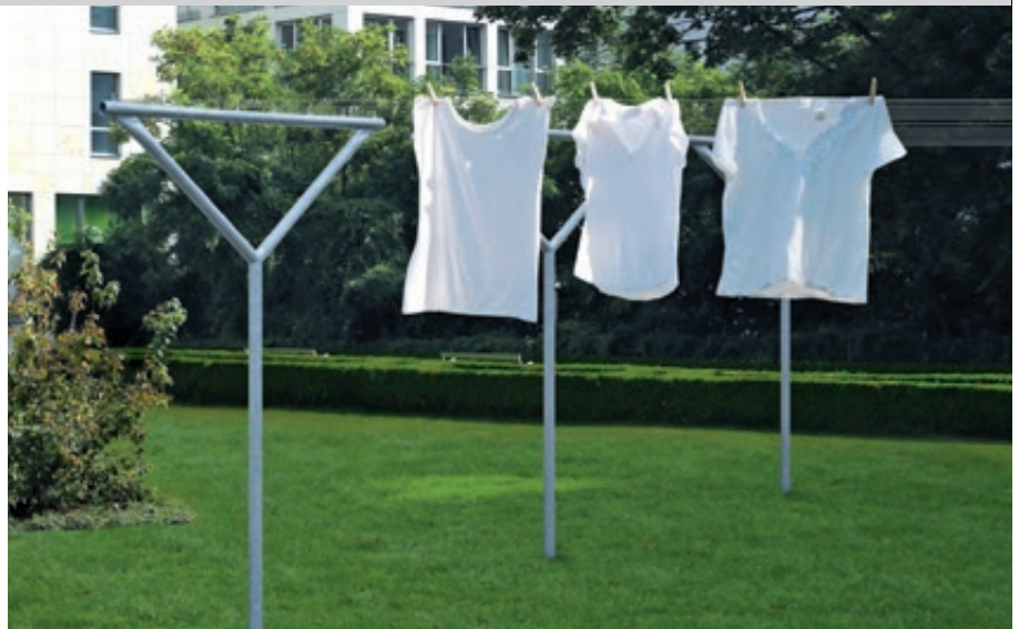
Wäschegerüst MAUBEC, feuerverzinkt