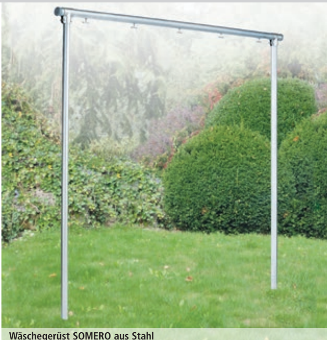
Wäschegerüst SOMERO aus Stahl