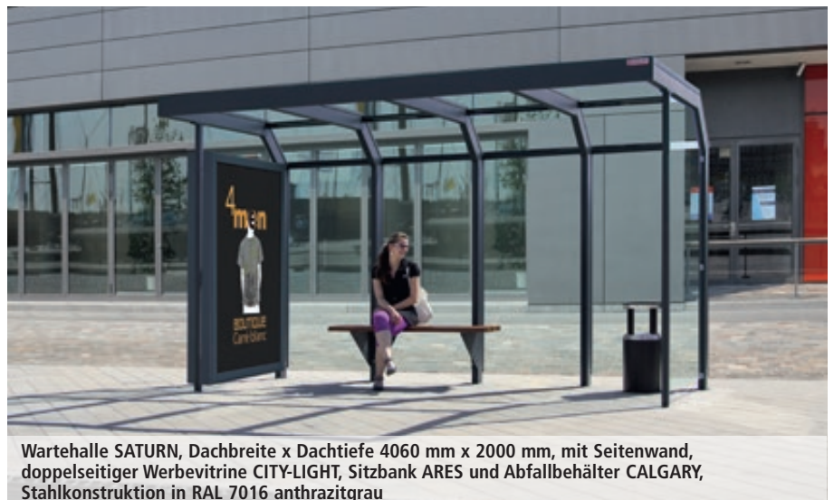
Wartehalle SATURN, Dachbreite x Dachtiefe 4060 mm x 2000 mm, mit Seitenwand, doppelseitiger Werbevitrine CITY-LIGHT, Sitzbank ARES und Abfallbehälter CALGARY, Stahlkonstruktion in RAL 7016 anthrazitgrau

Preis ohne Zubehör (Sitzbank), zuzüglich Fracht & Montage.