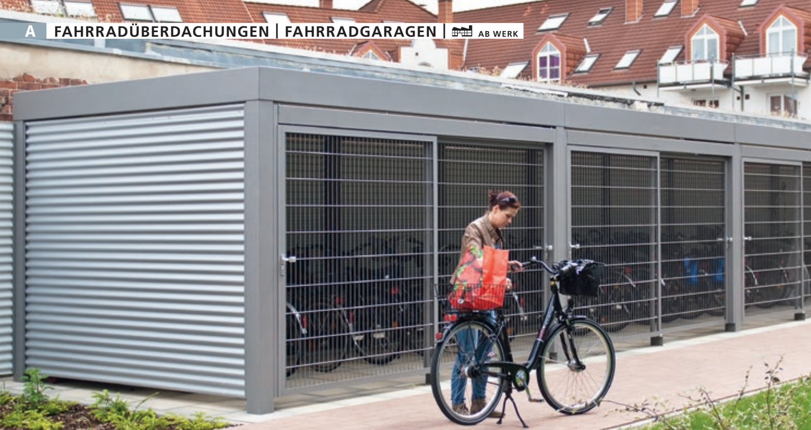
MULTIPOINT® Rad Dachbreite x Dachtiefe je Anlage 16000 mm x 8000 mm, Seiten- / Rückwände mit Doppelstabgittermatten, mit Fahrradparker HEDLAND, Stahlkonstruktion in RAL 7015 schiefergrau