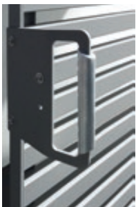
◀ Detail: Handgriff