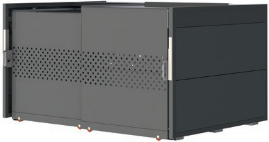
▲ Fahrradgarage STYLEOUT® BIKE QUBIS, Rück-, Seitenwände und Schiebetüren in RAL 7016 anthrazitgrau, Dach Aluminium eloxiert