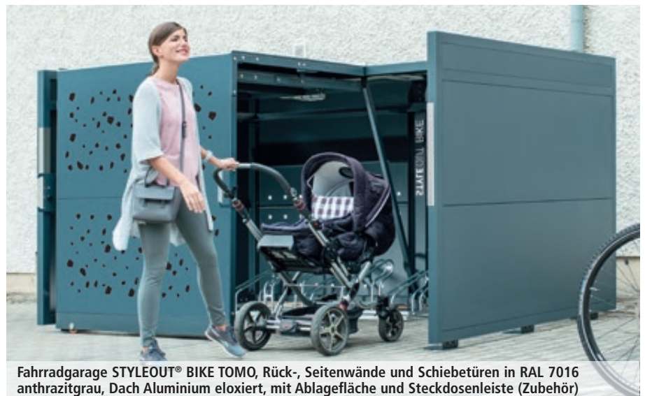
Fahrradgarage STYLEOUT® BIKE TOMO, Rück-, Seitenwände und Schiebetüren in RAL 7016 anthrazitgrau, Dach Aluminium eloxiert, mit Ablagefläche und Steckdosenleiste (Zubehör)