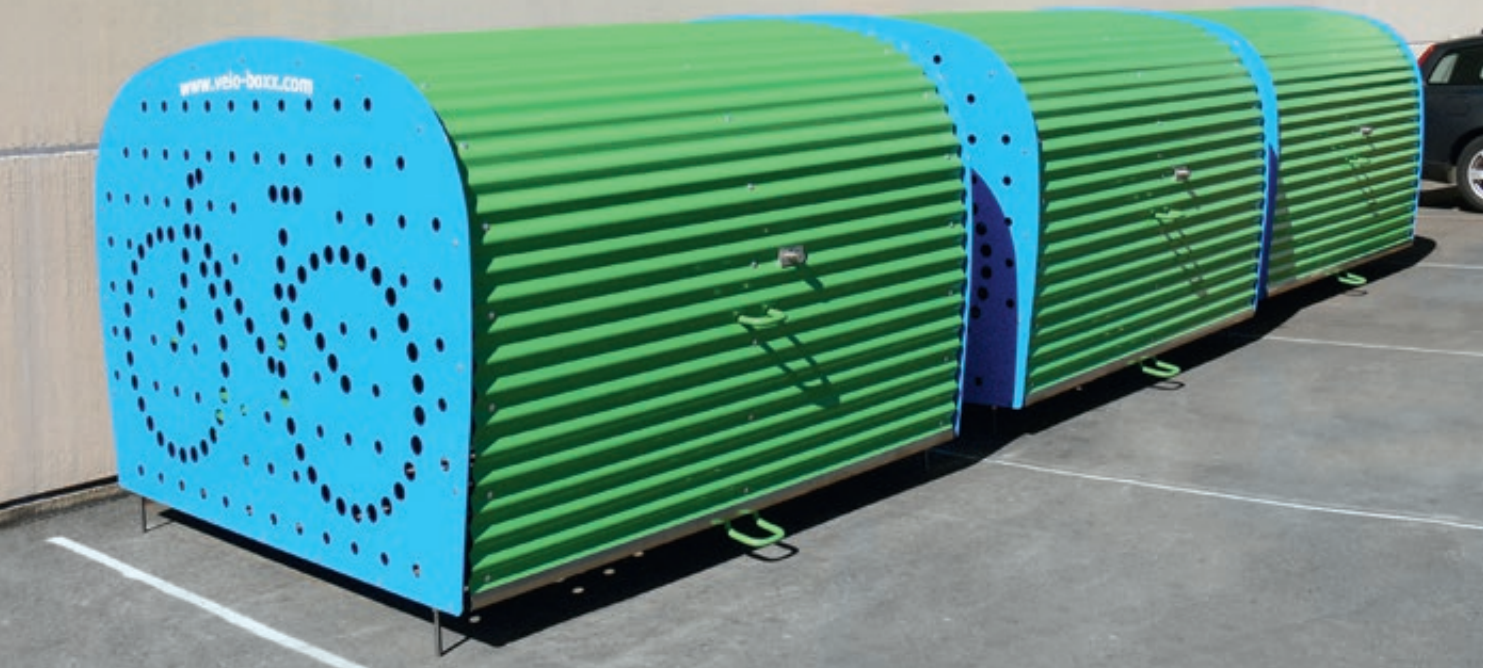
Fahrradgarage VELO-BOXX®-Professional mit Klappflügeltür aus Wellblech in RAL 6018 gelbgrün, Seitenwände in RAL 5012 lichtblau (auftragsbezogene Pulverbeschichtung)