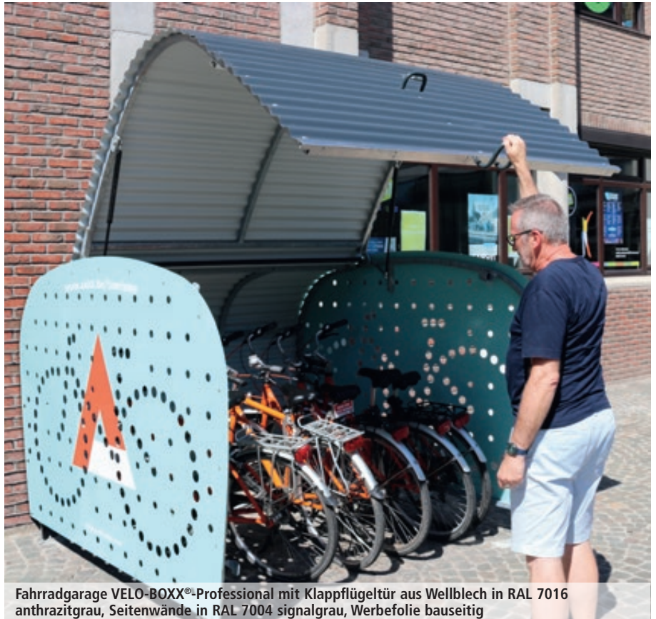
Fahrradgarage VELO-BOXX®-Professional mit Klappflügeltür aus Wellblech in RAL 7016 anthrazitgrau, Seitenwände in RAL 7004 signalgrau, Werbefolie bauseitig