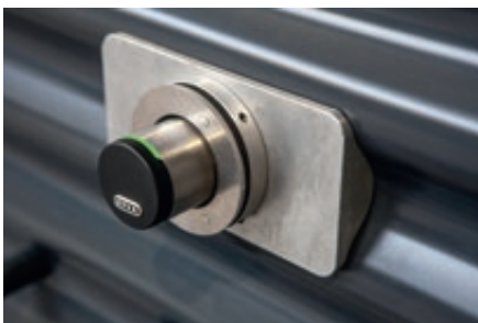
▲ Detail: Elektronisches Schließsystem